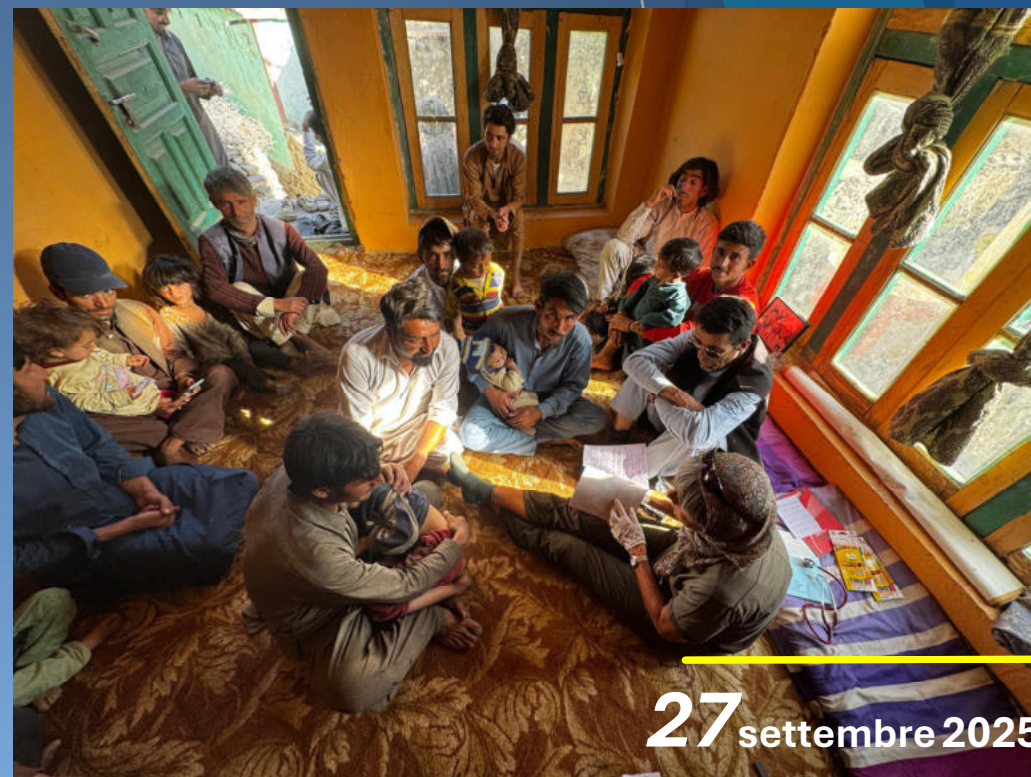
VISITE AL VILLAGGIO DI CHONGO