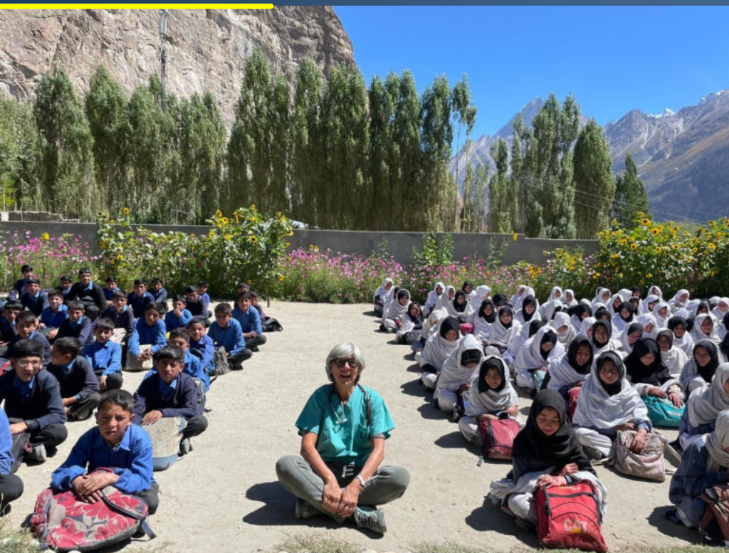
FORMAZIONE E SENSIBILIZZAZIONE A SCUOLA