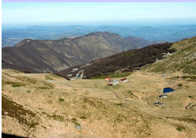
Crinale Monti della Riva, Valle del Dardagna