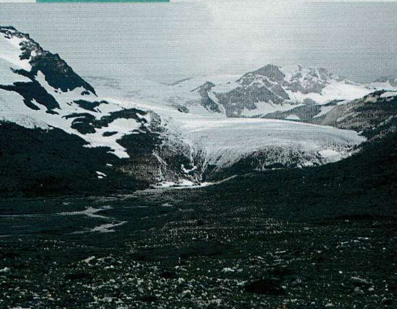
VEDRETTA LUNGA 1979