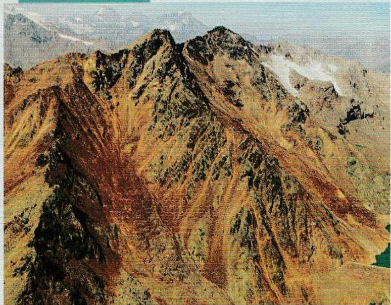
FONTANA BIANCA 2018