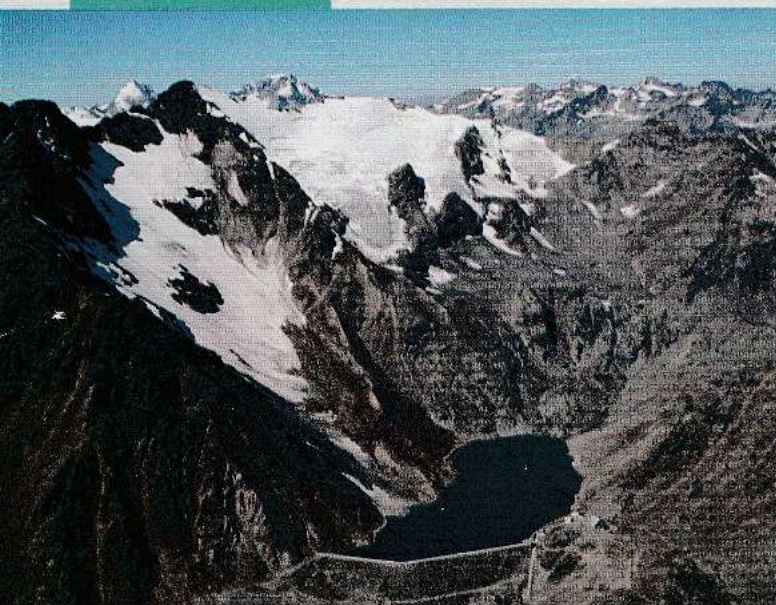
FONTANA BIANCA 1979