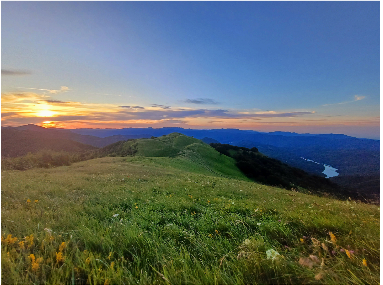
Alba sul Monte Antola