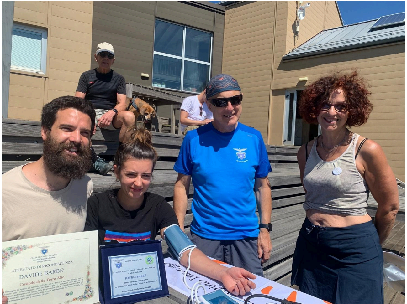
Foto 2: i gestori del rifugio, premiazione (nella stessa giornata) come Custode delle Terre Alte