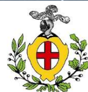
Comune di NARZOLE