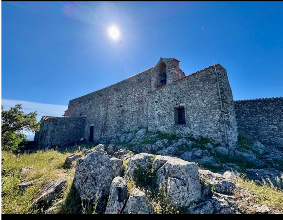
(Chiesa Monte Gonare)

Grandi storie di confine tra i giudicati Torres e Arborea. Conflitti e pacificazioni finte, amori finiti in tristi solitudini in quel castello che ancora domina sa Costera. il marchesato. I villaggi abbandonati con le pestilenze del'600. Orani un groviglio di storie comuni. Oggi insieme due comunità e le due case di accoglienza. Per sollevare gli sguardi da Aeddos. E fissare in lontananza la cuspide del monte. Gonare che insieme viviamo nell'anima. Nella sua storia o leggenda che viene dai mari d'oriente. Come annuali pellegrini Orotelli e Orani. Per chiedere e deporre fideuce e speranze. Lassù ai Suoi piedi dentro i graniti della chiesa. E osservare da Aeddos il suo gemello Nurdole dominate valli e fiumi e confini con i passaggi di Barbagia verso l'ignoto oltre Sant'Efis e il suo Nuraghe poi Città di Roma. Nurdole da villaggio in centro di grande culto delle acque divinizzanti e ricchezza di bronzi lavorati sino alla avanzata prima età del ferro. E Oddini, a ridosso del "serpente d'argento" di Cambosu., il grande fiume, le acque calde de Sa Barza, terapeutiche, per secoli attrazione di uomini e donne, Barbagia e