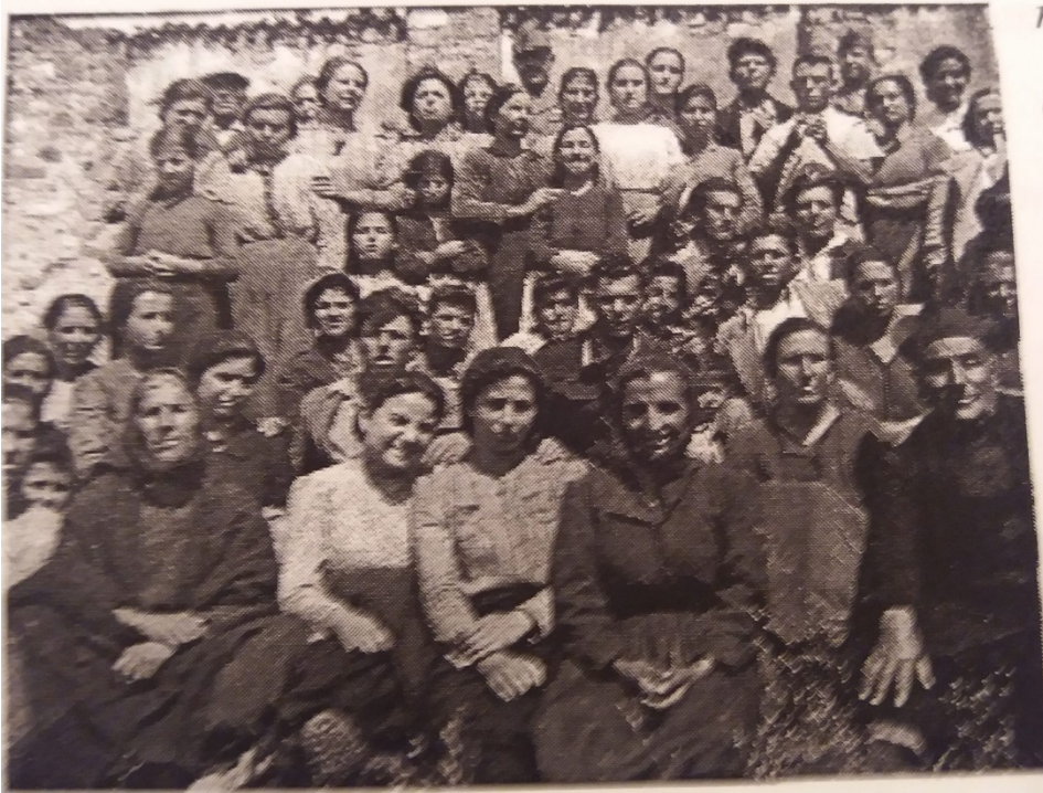
(1948 Santu Predu- Oddini)

Costera, sfiniti da fatiche senza tempo.