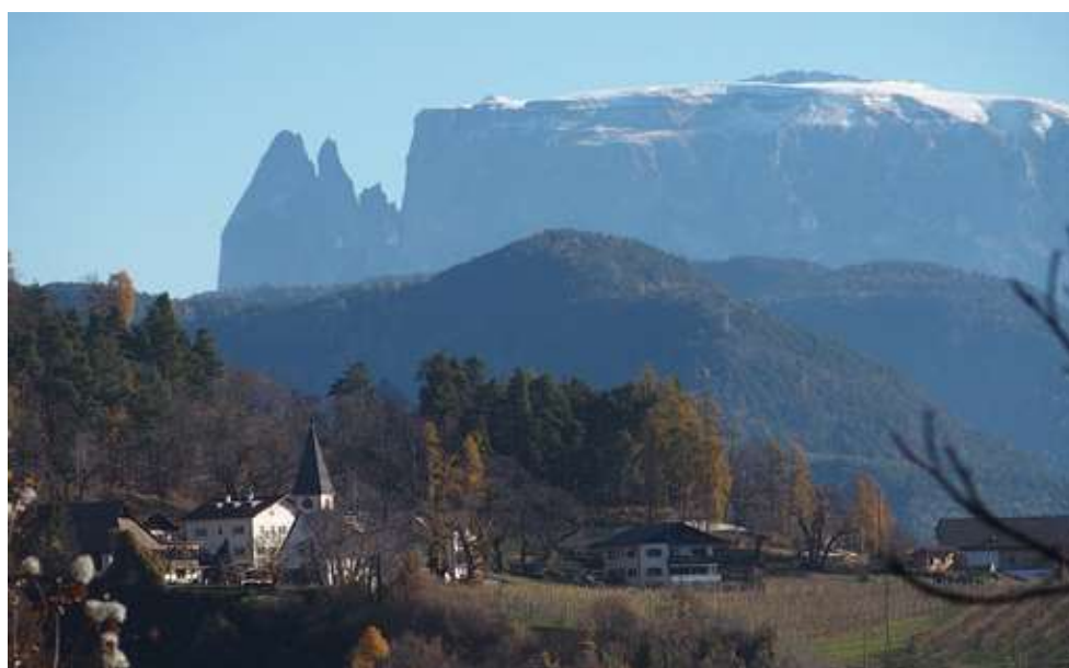
Cologna e lo Sciliar

di cervi giungiamo al punto in cui sulla sinistra si stacca il sentiero 11 per Plattner che prendiamo. Con una ripida salita nel bosco, sbucati a m 963 sulla strada asfaltata, raggiungiamo il ristorante Plattner (0.55-2.40) . Siamo a Cologna di Sopra e prendendo a destra raggiungiamo i due massi posti all'entrata della "Via di San Martino / Martinsweg" (0.20-3.00) . Continuando sulla carrareccia arriviamo a una biforcazione e tenendoci sulla sinistra ci portiamo al culmine dell'escursione odierna, m.1175. Siamo sul Montalto / Altenberg e da qui inizia la discesa seguendo il segnavia 6 con indicazione Bolzano-Scharfeck. Alternando tratti su forestale e lunghi tratti su sentiero sdruciolevole, per la quantità di foglie secche che ne coprono il fondo, raggiungiamo a m 925, all'altezza di un crocifisso, un belvedere da cui si domina Bolzano, Catinaccio e Latemar (0.45-3.45) . Continuando la discesa sbuchiamo a m 635 sulla strada per Cologna nei pressi del maso Trattner (0.35-4.20) . Seguendo il segnavia 5 attraversiamo la provinciale che sale a San Genesio e raggiungiamo Castel Guncina. Proseguiamo con la strada ripida che scende direttamente all'ex Hotel Germania e quindi sulla massicciata del sentiero 9 rientriamo a Gries (0.50-5.10) .