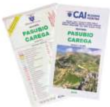
Pasubio Carega (2019) Scala 1:25.000