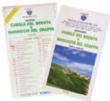
Canale del Brenta e Massiccio del Grappa (2016) Scala 1:25.000

Si ringrazia la Banca delle Terre Venete per il contributo emesso per il Cai di Montecchio Maggiore.