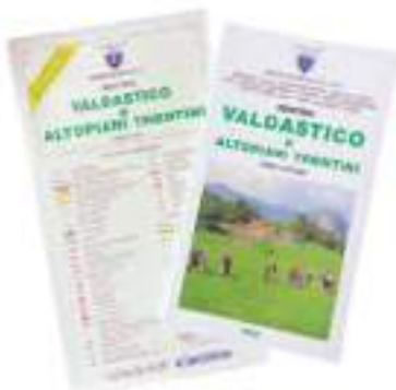
Valdastico e Altopiani Trentini (2023) · Scala 1:25.000