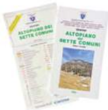
Altopiano dei Sette Comuni (2024) Scala 1:25.000