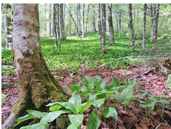
Sottobosco di Aglio orsino

IL Cai di Potenza ha perfettamente ristrutturato un rifugio, posto all'interno del Parco Nazionale dell'Appennino Lucano e Val d'Agri , chiamato Rifugio della Fontana delle Brecce. Si trova in una ampia radura erbosa, circondata da colossali esemplari di Cerro ( Quercus cerris ), ma soprattutto da un eccezionale bosco di faggio. Secondo le diverse quote, il bosco è formato da quercia, carpino, orniello ma a quote più elevate sono frequenti bellissimi esemplari di faggio. Mi ha colpito la presenza di stupende fustaie che, per loro caratteristica, dovrebbero avere un sottobosco coperto dai residui della naturale potatura che gli alberi, così datati, subiscono naturalmente. Il bosco di cui parlo invece, è perfettamente pulito, conseguenza della continua raccolta del legname e da pratiche selvicolturali che hanno prodotto boschi omogenei e coetanei.