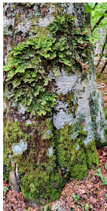
Tronco di faggio con Lobaria pulmonaria

Tutta la salita a Monte Arioso è sembrata idilliaca, tra boschi silenti, disturbati solo dal canto di qualche uccello, fino all'attraversamento di una ampia apertura nella vegetazione, contrassegnata da grandi pali di ferro sorreggenti uno skilift dismesso. Ovviamente, prima di arrivare in vetta, abbiamo incrociato una strada asfaltata di servizio per gli sciatori che un tempo salivano quassù. E sulla vetta del monte campeggia il punto di arrivo dell'impianto di risalita. Non è stato un bel vedere. Ci siamo consolati con il panorama che spaziava dai Monti Alburni al Sirino fino ai Monti del Pollino. Questo sì appagava lo sguardo.