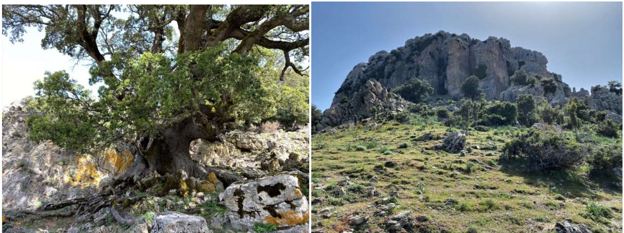
[Il leccio monumentale (sx) e M.te Fumai (dx)– foto S. Murru]

Dopo aver goduto della vista di un bel Leccio Monumentale, tramite un sentierino saliremo al Monte Fumai (1316 m). Una volta in vetta, potremo godere un panorama a 360 gradi, con le vette del Gennargentu, la cima di Punta Lolloine e anche il Tacco di Perda Liana.