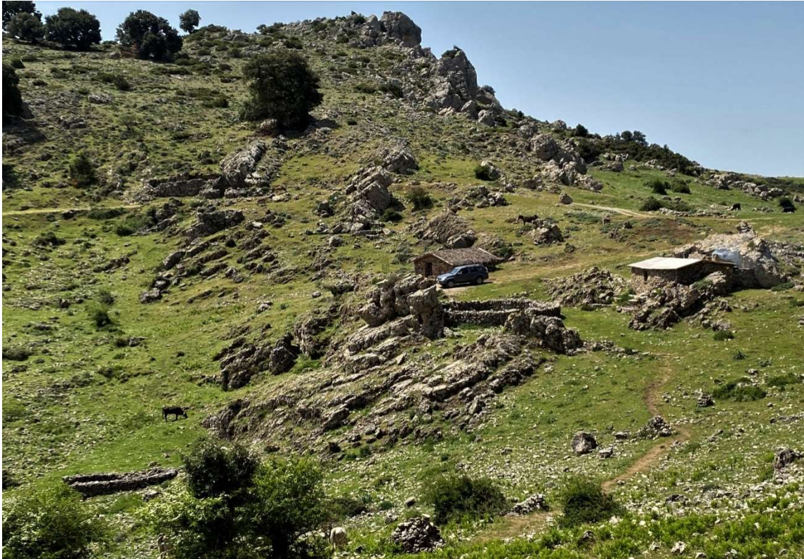
[Il Villaggio pastorale di Norculanu]

Tornati sul nostro sentiero, sempre in salita, andremo a visitare le varie strutture del Villaggio pastorale di Norculanu.