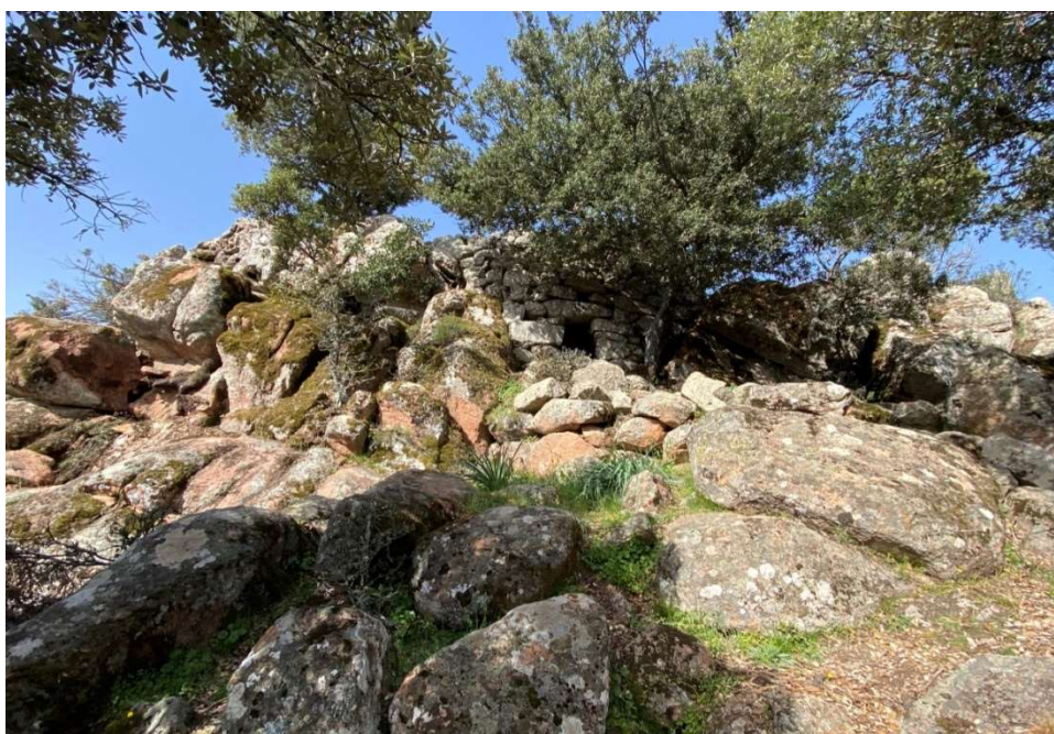
[Nuraghe Funtana Bona o "Nuragheddu"]

Si tratta di un giro ad anello che si sviluppa per circa 14 Km, toccando le due Cime più importanti del territorio di Montes: Monte Fumai e Monte Novo San Giovanni. Sistemate le auto nell'ampio parcheggio, presso la Foresteria a Funtana Bona di FORESTAS, ci inoltreremo in un serpeggiante sentiero sottobosco. Questo, sviluppandosi in salita, ci porterà a incontrare, prima un bellissimo leccio, poi con breve deviazione del percorso, andremo a vedere il Nuraghe Funtana Bona, chiamato anche Nuragheddu, incastonato sulla roccia e un grande Circolo Megalitico a breve distanza.