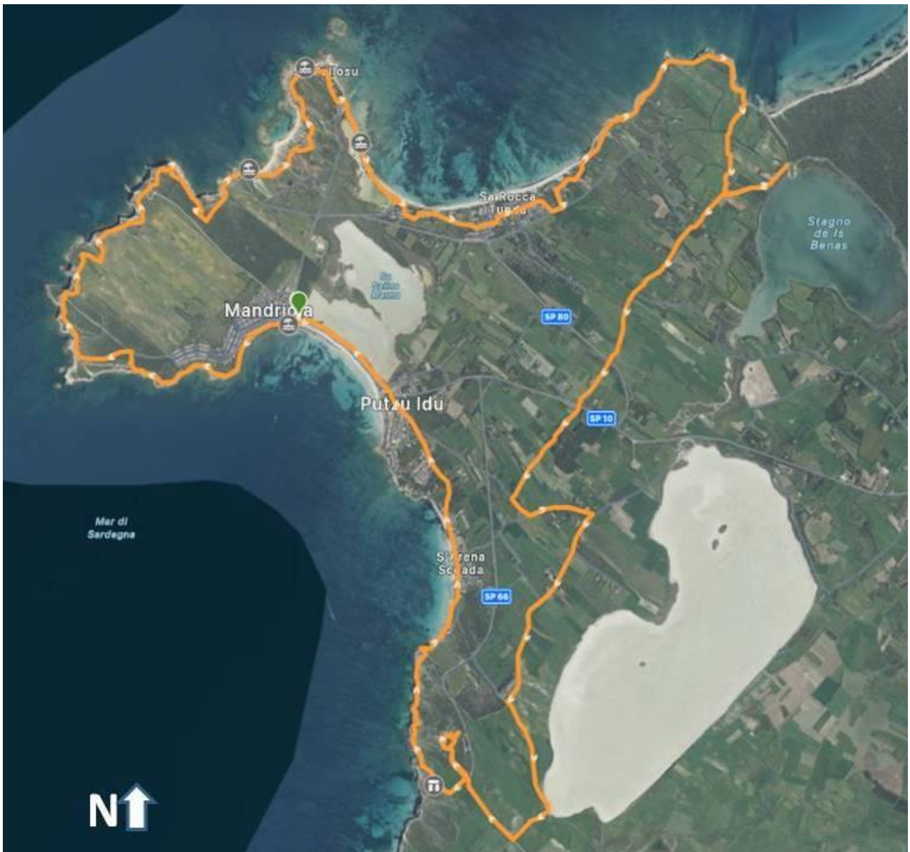
Traccia di WikilocLucio Deriu