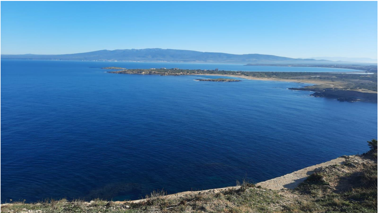
Figura 1: Panorama

PRESENTAZIONE: il MTB CAI di Oristano propone un'escursione che parte da loc. Mandriola, giro ad anello panoramico che tocca alcune località costiere.