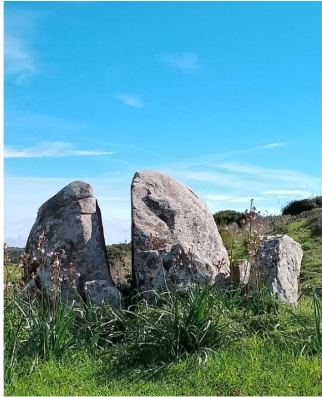
Figura 2- Sa Perda Sperrada

Monte Arci dove ci attende la parte più impegnativa del percorso, una lunga salita sterrata a tratti sconnessa che ci porterà al punto panoramico che domina tutta la vallata sottostante con all'orizzonte le bellissime Giare di Gesturi e di Siddi e non solo. A due passi il Nuraghe Inus e il Centro di Accoglienza Turistico. Si riparte con una bellissima quanto ripida discesa che ci porta dritti al monumento naturale di Sa Perda Sperrada tradotto "La pietra spaccata" testimonianza dell'azione erosiva degli agenti atmosferici di caldo e freddo di milioni di anni fa, anch'esso di origine vulcanica. Del resto il vicino Monte Arci è un vulcano antichissimo ormai spento, in antichità fu il più grande giacimento di ossidiana di tutto il mediterraneo.