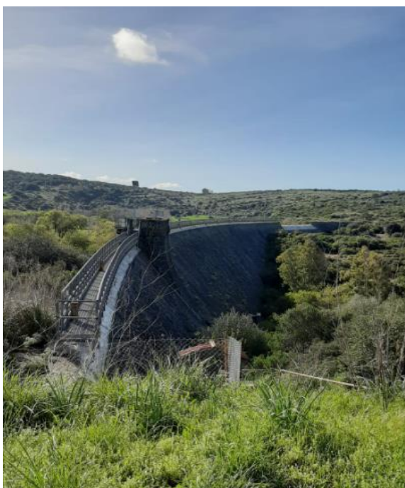
Figura 2 – Diga S. Vittoria

Dopo una brevissima presentazione del giro la prima tappa da raggiungere sarà la Diga di Santa Vittoria sul rio Mogoro. Bell'esempio di ingegneria che risale al periodo della Bonifica della piana di Terralba-Arborea-Uras-Mogoro. Piccola pausa vicino al fiume.