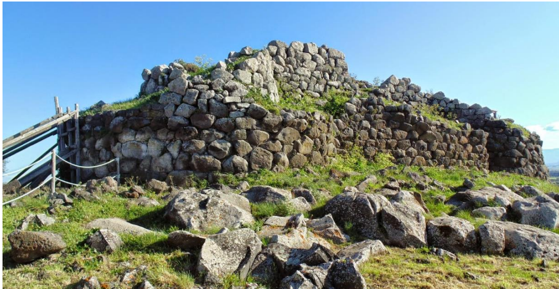
Figura 1: Nuraghe Cuccurada

PRESENTAZIONE: il MTB CAI di Oristano propone un'escursione che si snoda nel territorio della bassa Marmilla e del Monte Arci. Il giro interessa tre comuni, monumenti naturali, archeologici e le campagne che in primavera mostrano al ciclista che le attraversa il meglio di se.