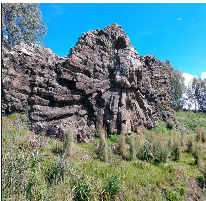
Figura 3- Mega Pillow

Attraverso sterrati si arriva in territorio del comune di Masullas per ammirare il monumento naturale risalente a 20 milioni di anni fa di origine vulcanica il Mega Pillow, Su Corongiu de Fanari . Molto suggestivo e interessante in particolare per gli amanti di geologia. Uno scatto è d'obbligo. Si prosegue per un giro dentro il paese con la sua bellissima chiesa della Beata Vergine delle Grazie parrocchia del paese, le due piccolissime chiese romaniche di Santa Lucia e San Leonardo e il GeoMuseo MonteArchi e Storia Naturale "Aquilegia" che ha sede in un antico e ben restaurato convento. Al suo interno reperti provenienti da tutto il mondo alcuni molto rari. Si prosegue alla volta di Siris piccolo paese ricco di murales e da qui alla volta di