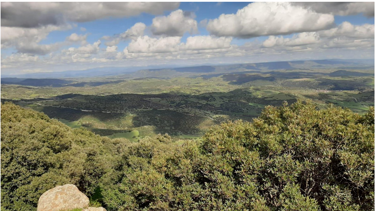
Figura 3- Panorama