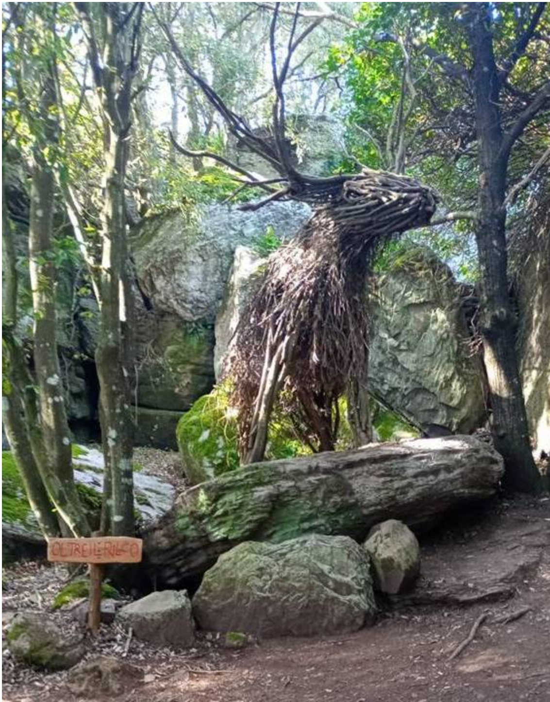
[Uno dei manufatti del Bosco di Fiaba]