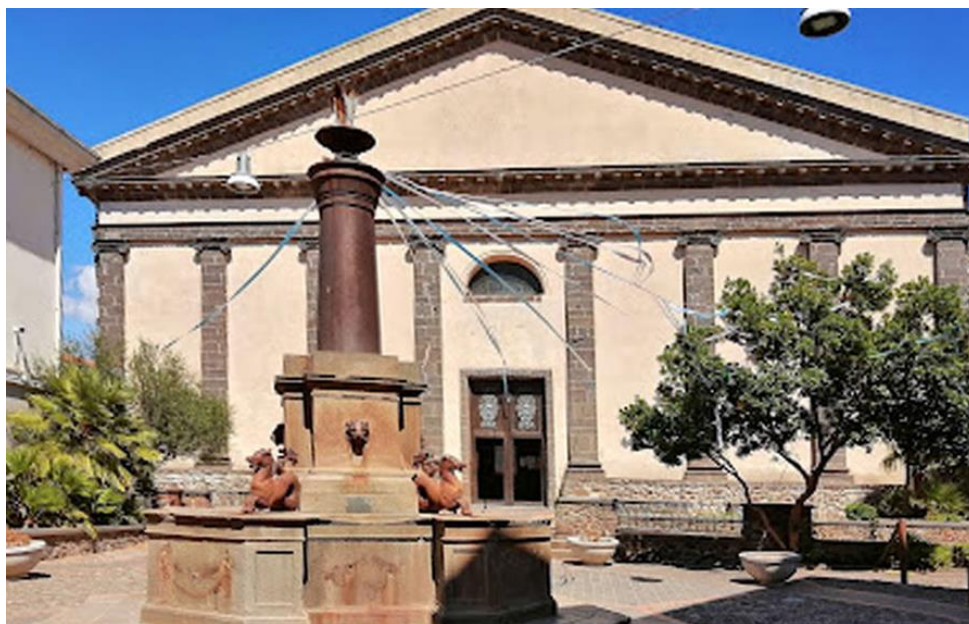
Figura 1: Chiesa Santa Maria Immacolata

PRESENTAZIONE: il MTB CAI di Oristano propone un'escursione che si snoda con partenza nel territorio di Narbolia, e interessa i comuni di Seneghe e Santa Caterina (Comune di Cuglieri), con visita a monumenti naturali, archeologici e boschi con il fascino dell'autunno.