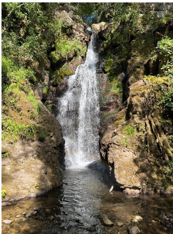
Figura 3 – Cascata Bia Josso

Dopo un breve tratto di strada asfaltata un pò dissestata ci troviamo davanti alla Ex sanatorio, proseguendo addentrandoci nella bosco potremo visitare il Nuraghe Ruiu, la casa del Cacciatore e alcuni alberi monumentali.