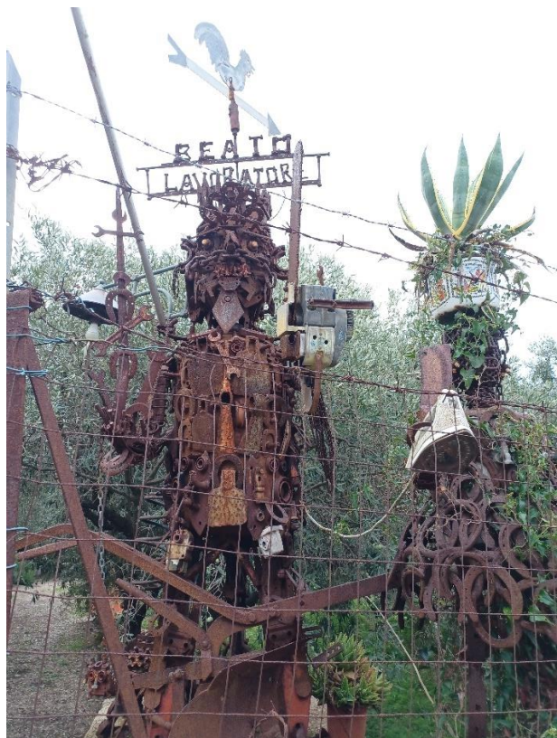
Figura 2 – L'uomo di Ferro

DESCRIZIONE: l'escursione prenderà il via dal parcheggio dal sito nella periferia di Narbolia, il giro proseguirà verso l'abitato di Seneghe dove troveremo la cattedrale da visitare.