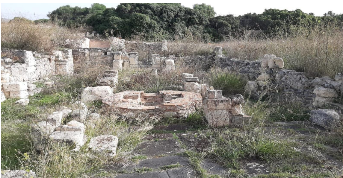
Area Archeologica di Cornus

Anello tra scogliere nel blu, campagne e siti archeologici.