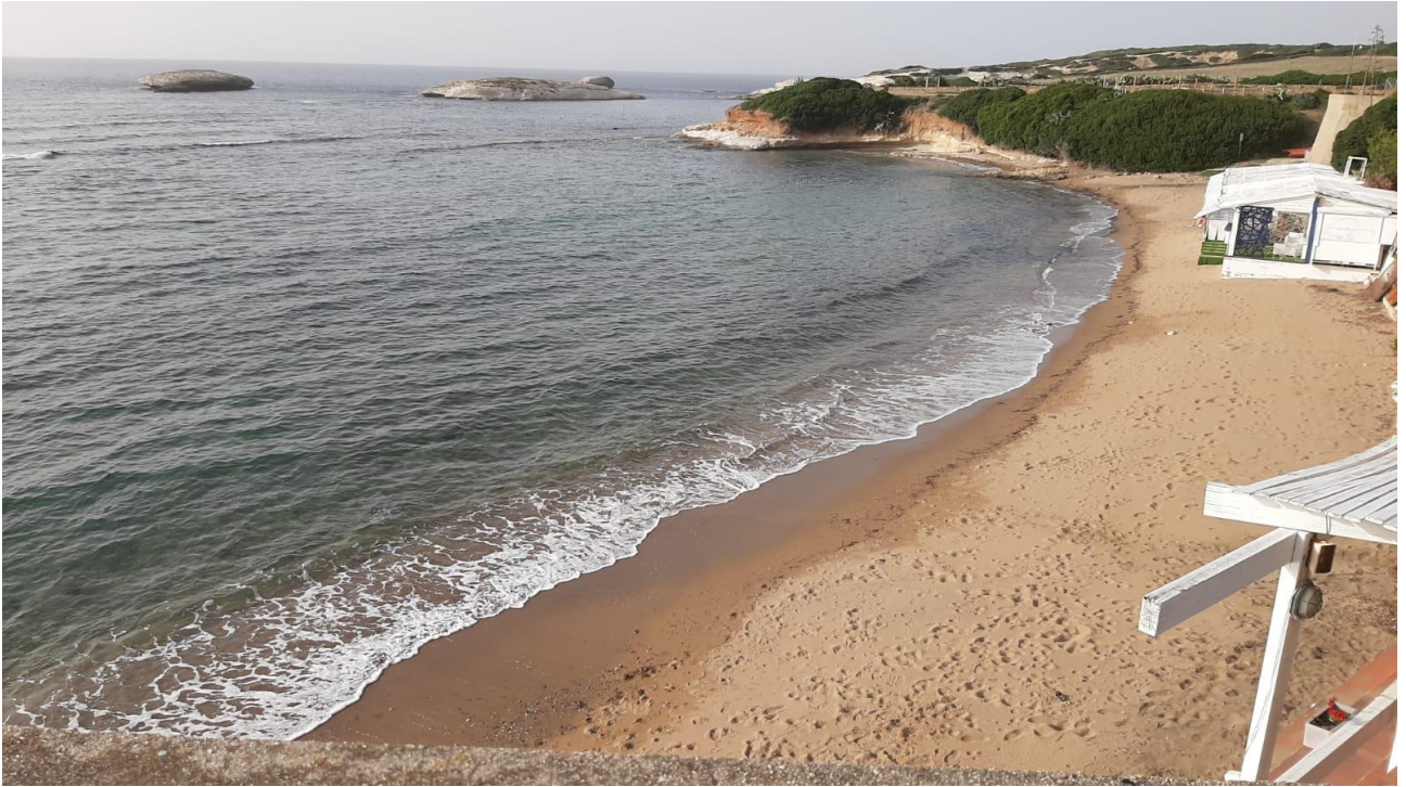
Spiaggia di S'Archittu