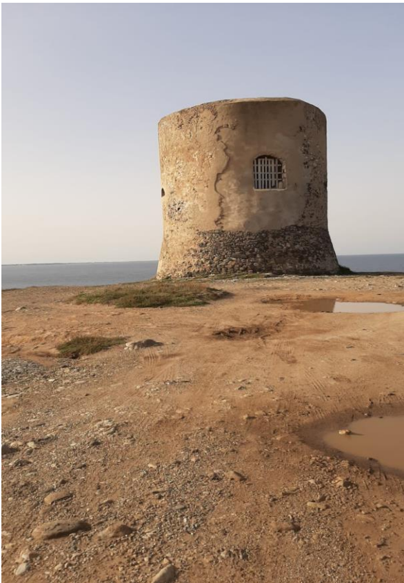
Torre di Santa Caterina di Pittinuri