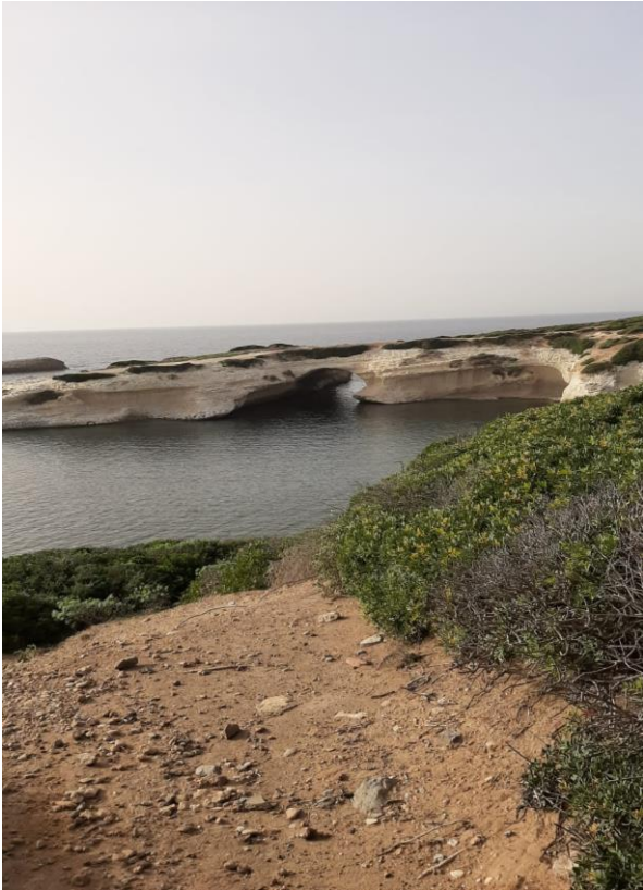
Archetto di Sarchittu