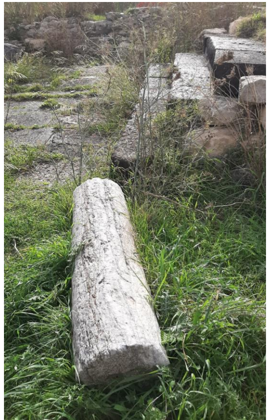
Dettaglio sito Cornus