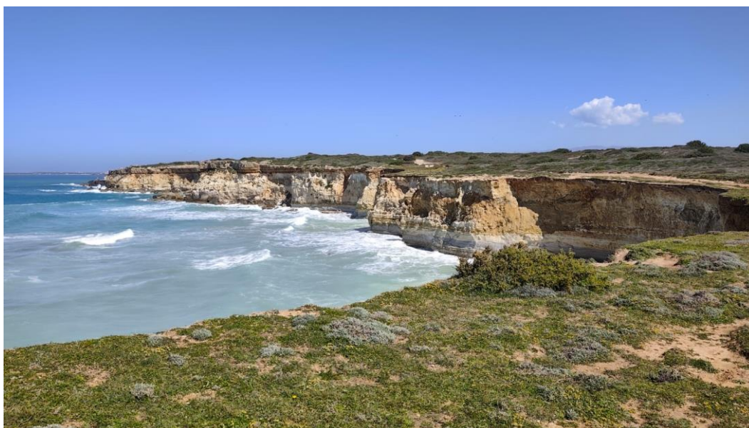
Foto: Falesia su Tingiosu

Anello mare, spiagge, scogliere, archeologia e campagne.