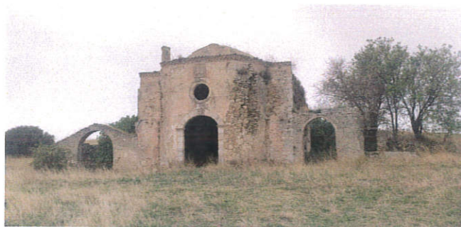
Monastero Santa Maria D'Irsi