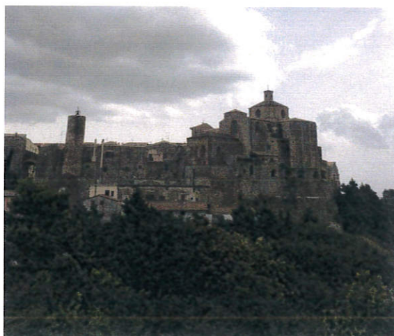
Fine escursione Grazie a tutti