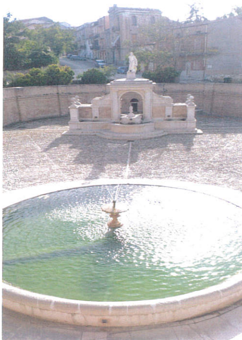
Inizio Escursione Fontana Cavallina Genzano