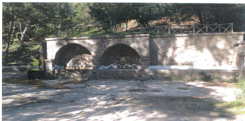
Lavatoi Capo D'acqua