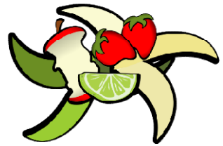
Non abbandonare rifiuti