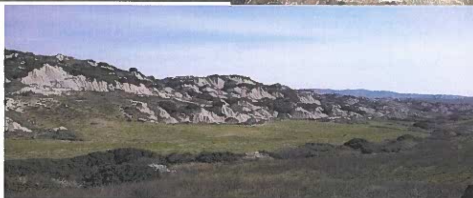
CALANCHI DI ALIANO