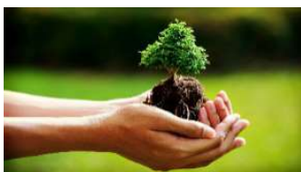
Rispetta la bellezza della natura

Per tutto quanto non specificamente indicato nel presente programma si fa riferimento al Regolamento delle Escursioni della Sezione CAI di Potenza che i partecipanti, iscrivendosi all'attività, confermano di conoscere e di accettare.