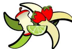
Non abbandonare rifiuti