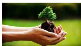
Rispetta la bellezza della natura

Per tutto quanto non specificamente indicato nel presente programma si fa riferimento al Regolamento delle Escursioni della Sezione CAI di Potenza che i partecipanti, iscrivendosi all'attività, confermano di conoscere e di accettare.