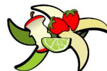
Non abbandonare rifiuti