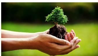
Rispetta la bellezza della natura

Per tutto quanto non specificamente indicato nel presente programma si fa riferimento al Regolamento delle Escursioni della Sezione CAI di Potenza che i partecipanti, iscrivendosi all'attività, confermano di conoscere e di accettare.