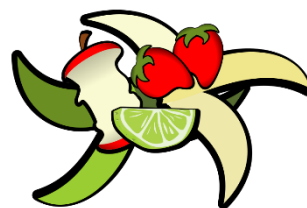
Non abbandonare rifiuti