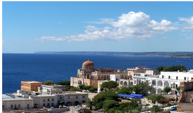
SANTA CESAREA TERME