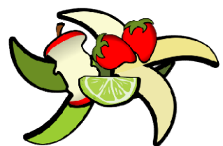
Non abbandonare rifiuti