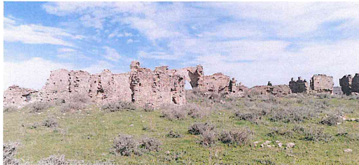
Rovine del Castello di Uggiano