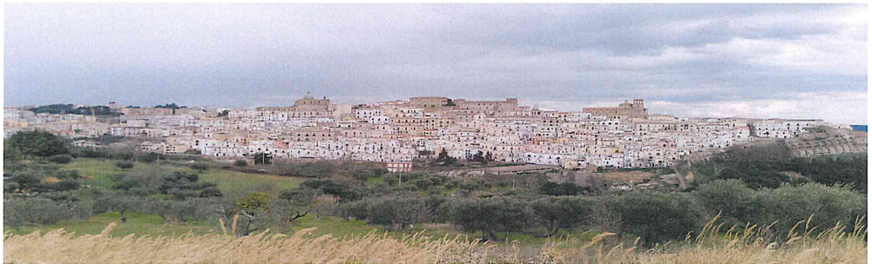
Panoramica di Ferrandina