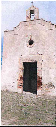
Madonna della Stella