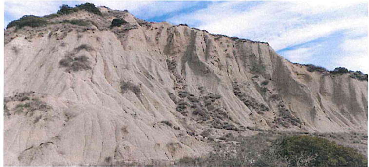
Calanchi di Ferrandina