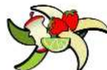
Non abbandonare rifiuti