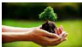
Rispetta la bellezza della natura

Per tutto quanto non specificamente indicato nel presente programma si fa riferimento al Regolamento delle Escursioni della Sezione CAI di Potenza che i partecipanti, iscrivendosi all'attività, confermano di conoscere e di accettare.