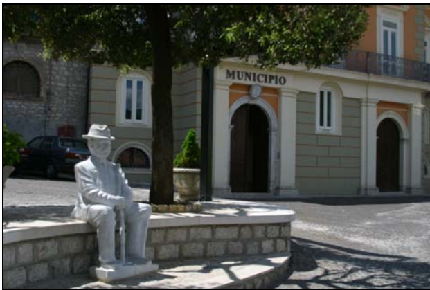
Largo San Michele (sede del Municipio)