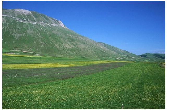
I piani di Castelluccio di Norcia e, sullo sfondo, i monti Sibillini