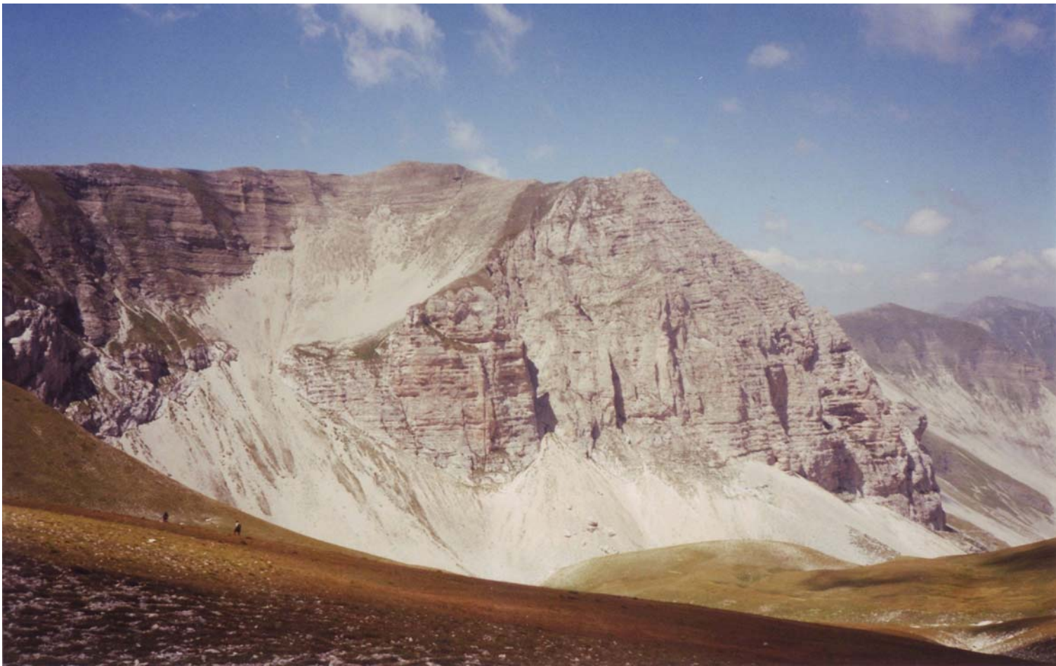
La cresta del Redentore vista dal Rifugio Zilioli