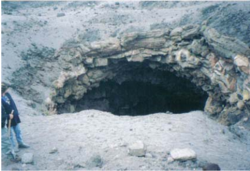
L'ingresso della grotta