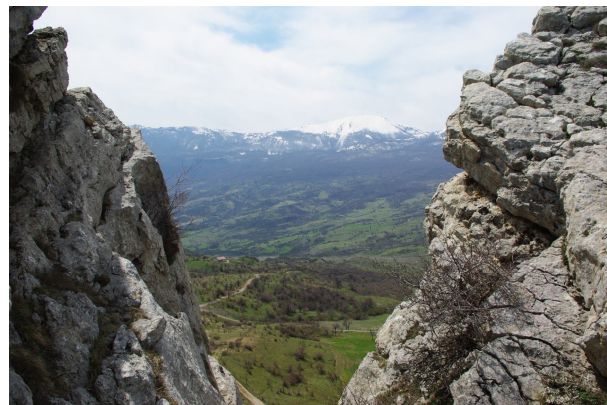
Dalla Falconara, il Dolcedorme sullo sfondo