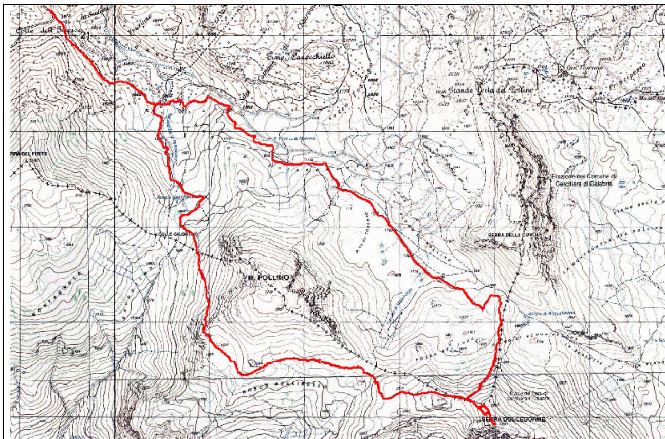
Cartina dell'escursione di lunedì 1° giugno su Serra Dolcedorme

Dislivello complessivo: m. 700 circa - Grado di difficoltà: EE - Tempo di percorrenza: 8 ore