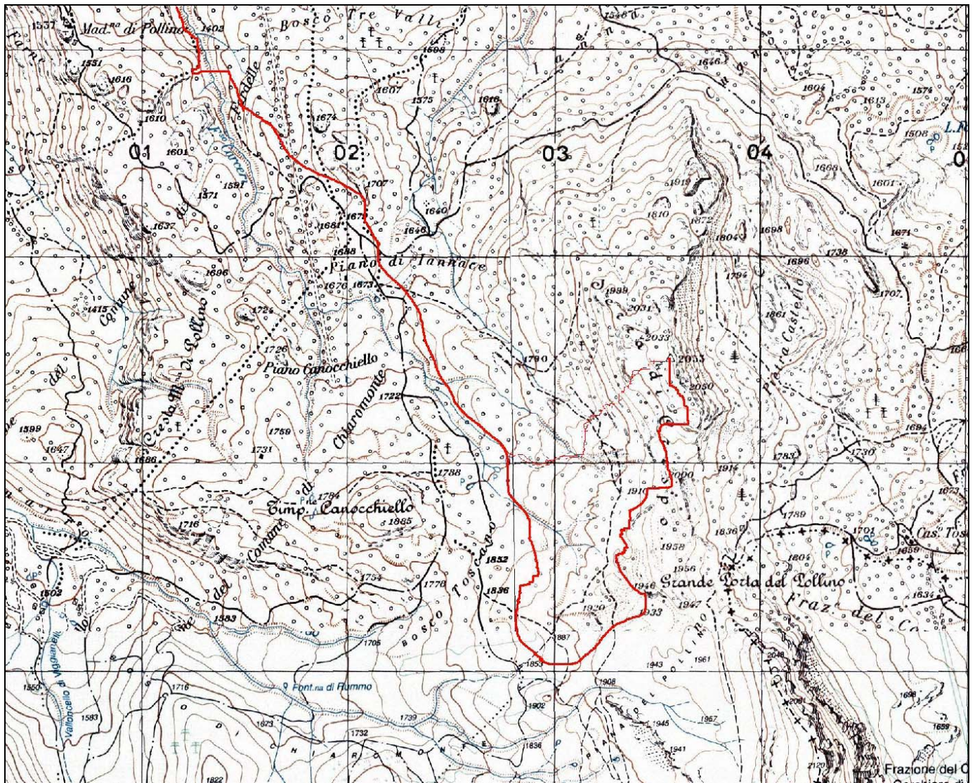
Cartina dell'escursione di domenica 31 maggio su Serra di Crispo