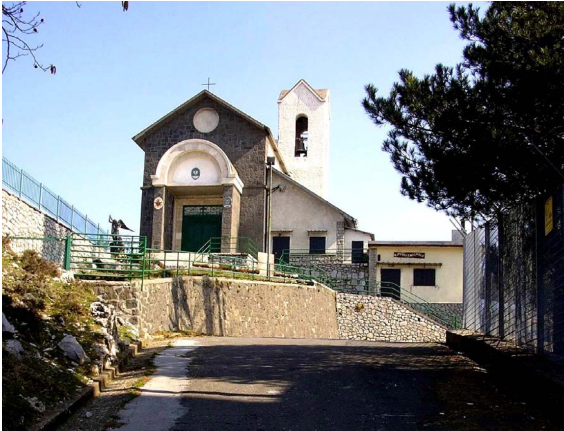
La Chiesetta di San Michele al Faito, punto di partenza dell'escursione