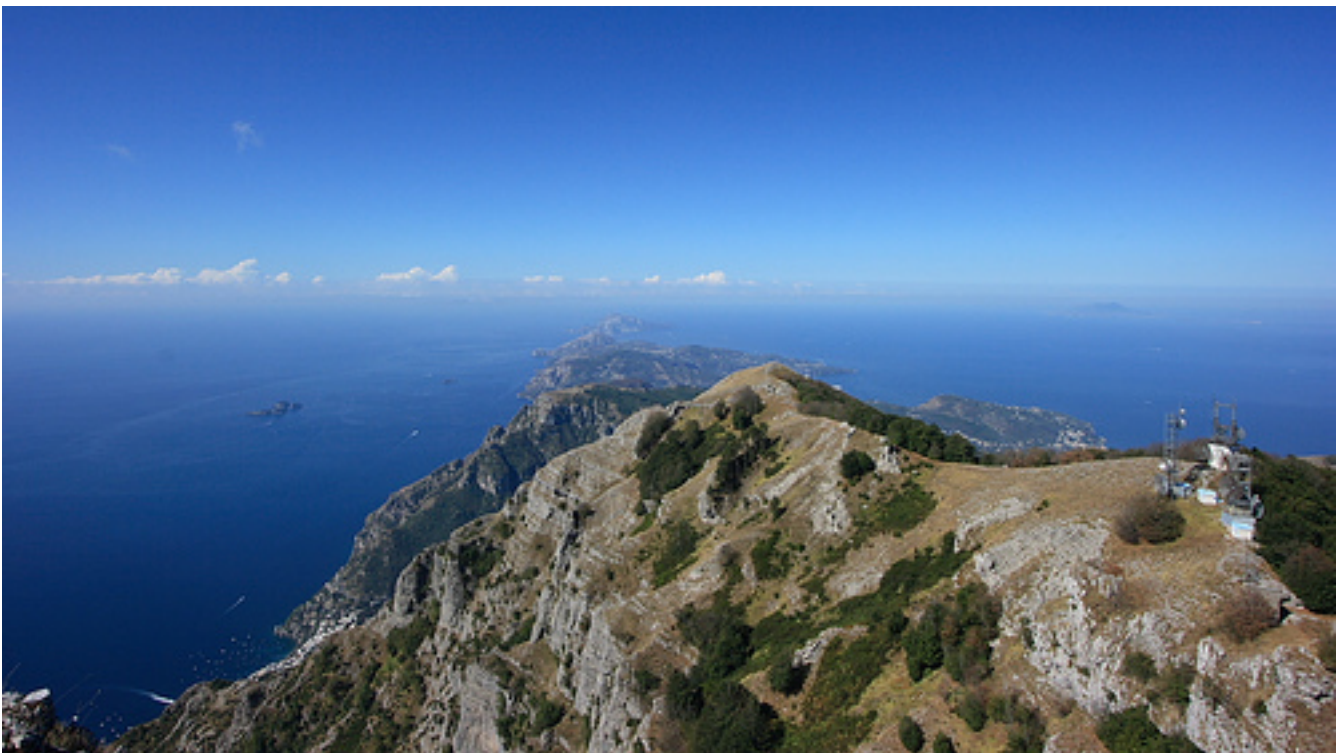
La vista dalla cima del Molare