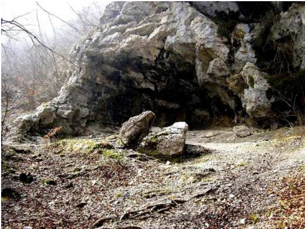
La grotta all'interno della quale sgorga la sorgente di Acqua Santa