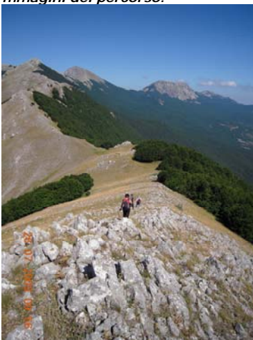
Da Timpa del Principe