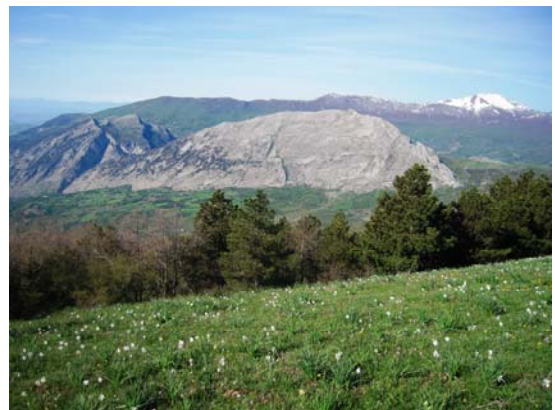
Il percorso di cresta con il Dolcedorme innevato sullo sfondo, visto da Timpa della Rotondella