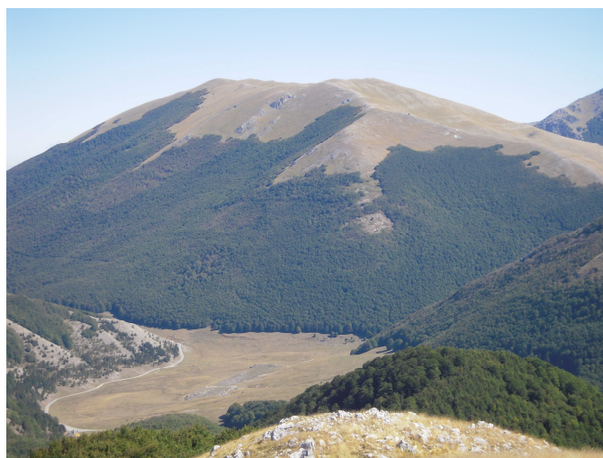
Piano Ruggio e Serra del Prete viste da Coppola di Paola