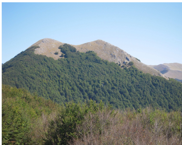
Le cime di Coppola di Paola viste da Cozzo Ferriero

Obblighi dei partecipanti: Essere a conoscenza del regolamento delle escursioni ed accettarlo e quindi: Partecipare alla riunione per l'iscrizione all'escursione e versare la quota richiesta. Essere fisicamente preparati ed in possesso di abbigliamento ed attrezzatura adeguati all'escursione. Attenersi esclusivamente alle disposizioni impartite dagli organizzatori non abbandonando il gruppo e collaborando per la riuscita dell'escursione. Prevedendo l'utilizzo della propria autovettura, presentarsi al raduno già riforniti di carburante. Essere puntuale all'appuntamento.