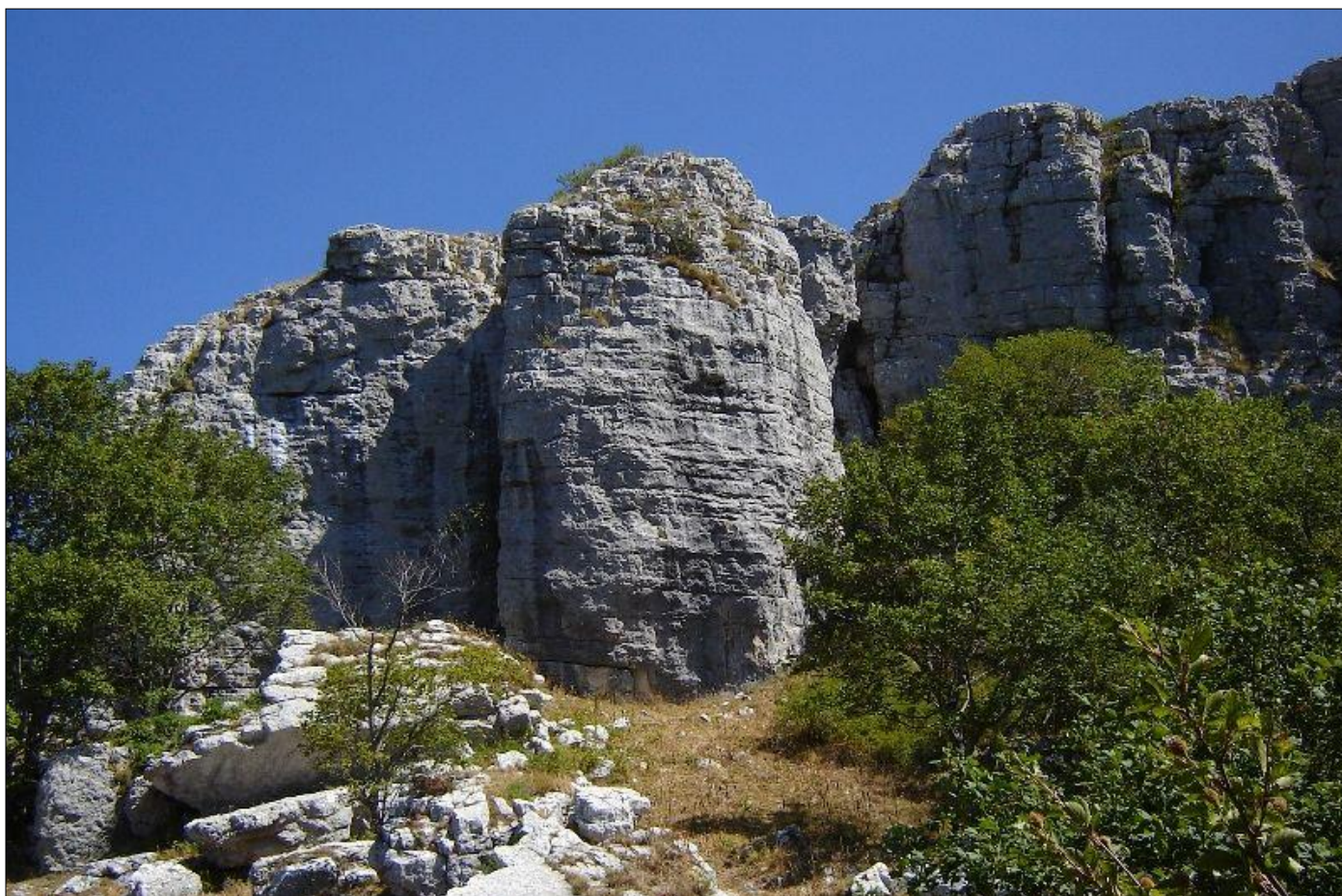
Ai piedi del Figliolo

Per tutto quanto non specificamente indicato nel programma ci si riporta al Regolamento delle Escursioni della Sezione che, i partecipanti, iscrivendosi all'attività, confermano di conoscere e di accettare.