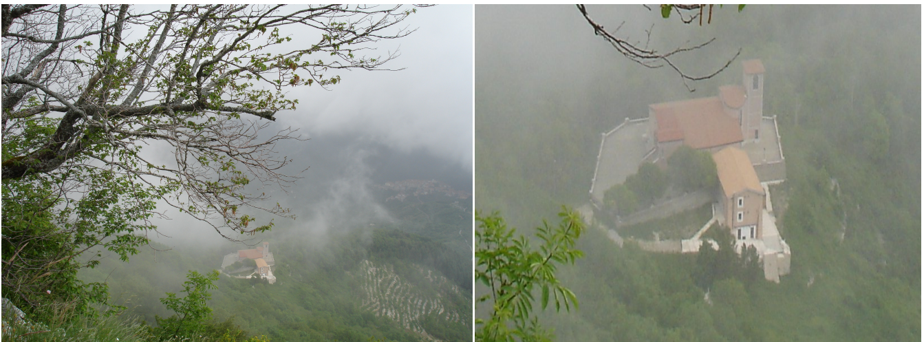
Santuario Madonna della Neve