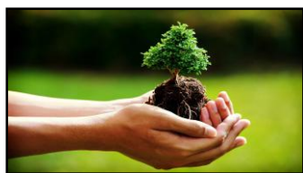
Rispetta la bellezza della natura

Per tutto quanto non specificamente indicato nel presente programma si fa riferimento al Regolamento delle Escursioni della Sezione CAI di Potenza che i partecipanti, iscrivendosi all'attività, confermano di conoscere e di accettare.