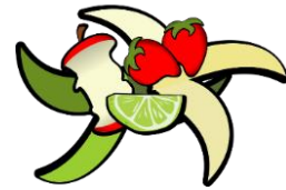
Non abbandonare rifiuti