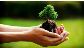
Rispetta la bellezza della natura

Per tutto quanto non specificamente indicato nel presente programma si fa riferimento al Regolamento delle Escursioni della Sezione CAI di Potenza che i partecipanti, iscrivendosi all'attività, confermano di conoscere e di accettare.