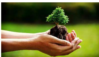
Rispetta la bellezza della natura rifiuti

Per tutto quanto non specificamente indicato nel presente programma si fa riferimento al Regolamento delle Escursioni della Sezione CAI di Potenza che i partecipanti, iscrivendosi all'attività, confermano di conoscere e di accettare.