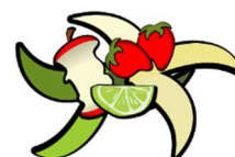
Non abbandonare rifiuti