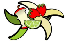
Non abbandonare rifiuti