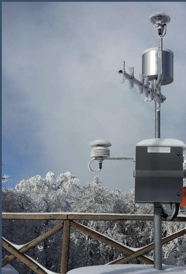
stazione meteo CFR Toscana al Monte Amiata