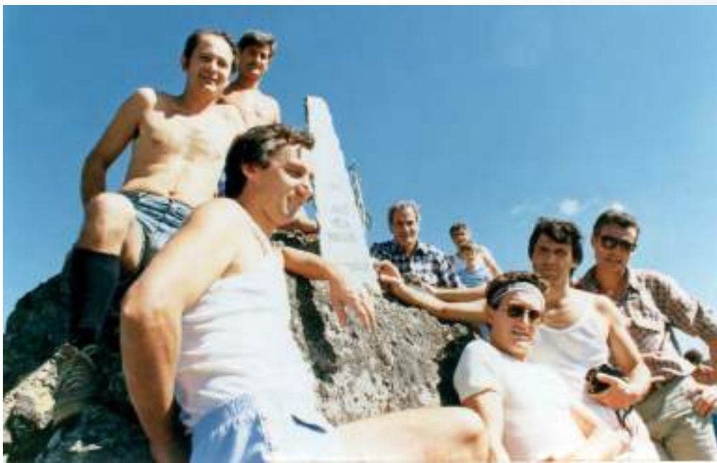
In alto: Rifugio C. Mores, Val Formazza, 2504 mt (anni '70) A destra: ferrata Minonzio allo Zuccone Campelli, Valsassina, 2161 mt (anni '90) In basso a sinistra: Corni di Sardegnana (Crocino), 2507 mt (anni '90)