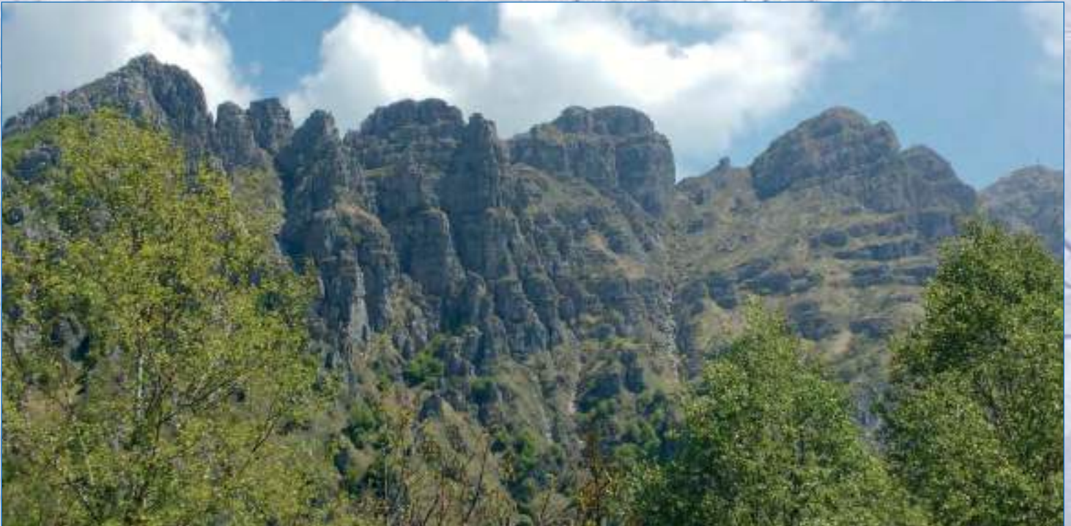
Resegone, 1875 mt