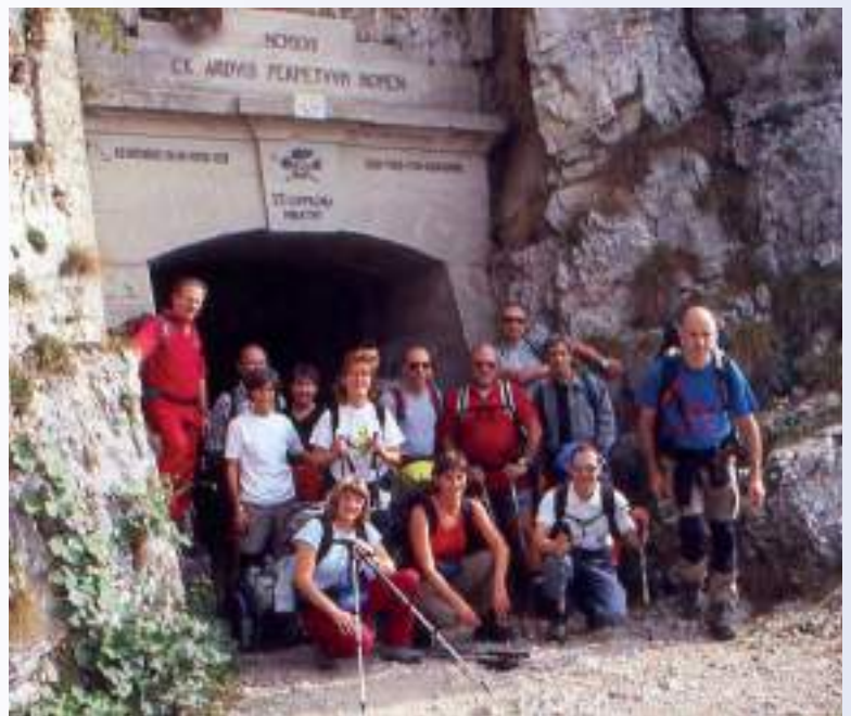
In alto a sinistra: notturna al rifugio Murelli, 1200 mt (2012) In alto a destra: Monte Palanzone, 1436 mt (2007) In basso a sinistra: sui sentieri della Val d'Intelvi (2007) In basso a destra: Monte Pasubio, strada delle Gallerie (2007)