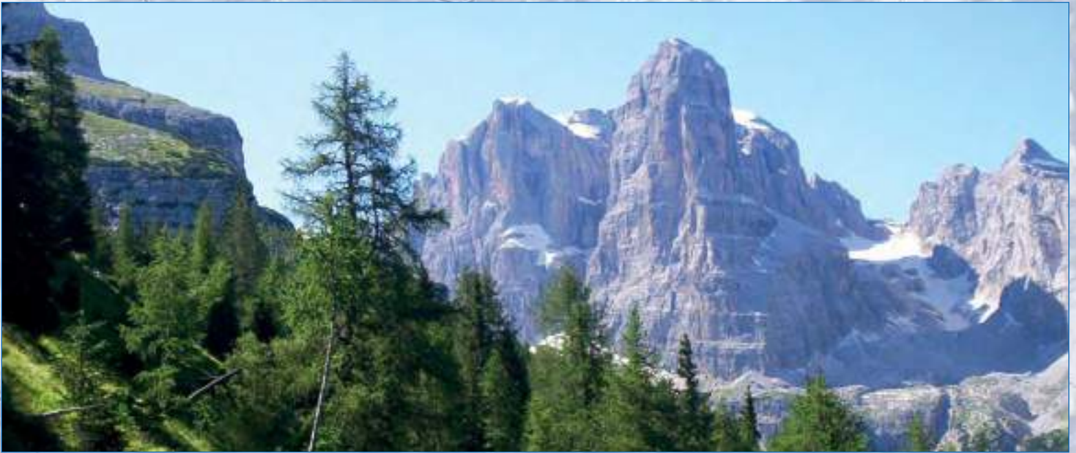
Crozzon di Brenta, Dolomiti di Brenta, 3135 mt