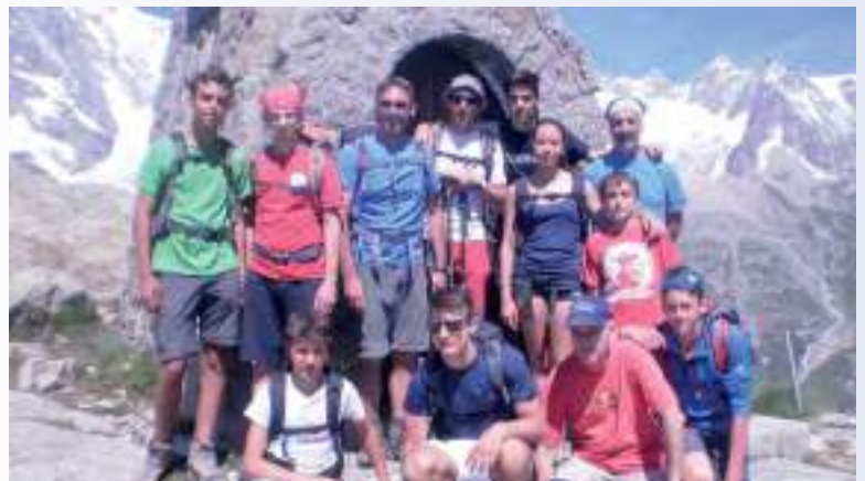
In alto a sinistra: Tirecorne, Courmayeur, 1955 mt (2014)