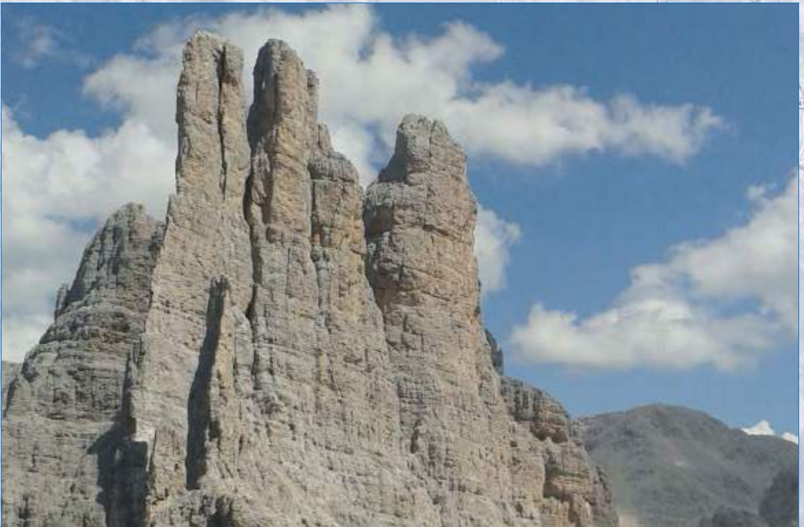
Torri del Vajolet, 2821 mt