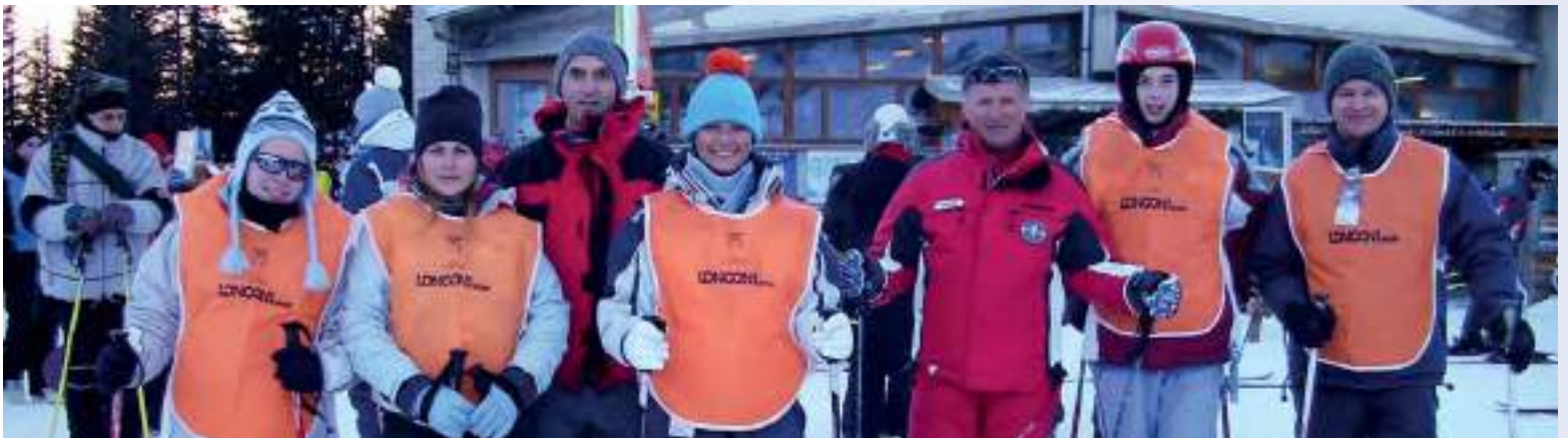
In alto a sinistra: Chiesa Valmalenco, corso di sci (2007) In alto a destra: Chiesa Valmalenco, corso di sci (2008) Al centro a destra: Chiesa Valmalenco, corso di sci (2014) In basso: Chiesa Valmalenco, corso di sci (2006)