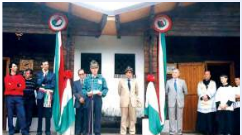
L'inaugurazione (26 giugno 1988)