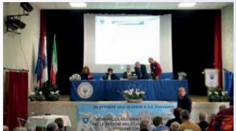
Assemblea Regionale del Club Alpino Italiano, Veduggio con Colzano (25 ottobre 2015)