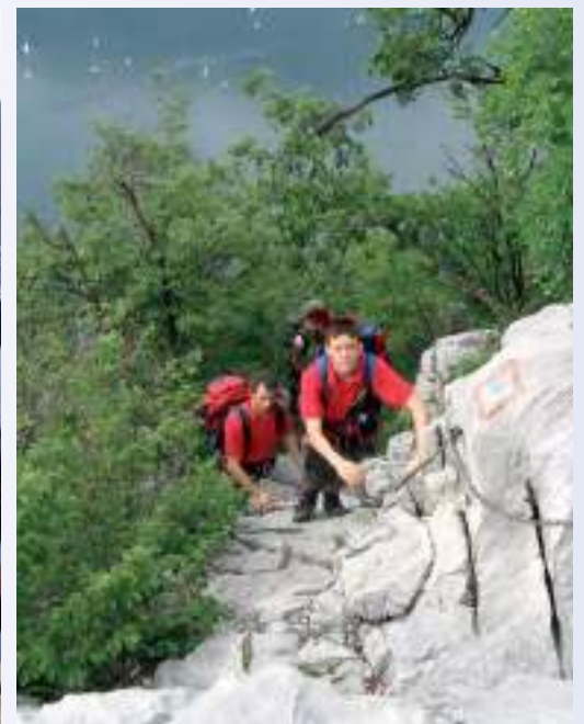
In alto a sinistra: salita al Resegone, 1875 mt (anni '90) In alto a destra: Alpe del Vicerè, prove di orientamento (2005) In basso a sinistra: Riva del Garda (2005) In basso a destra: sentiero dei Pizzetti (2005)