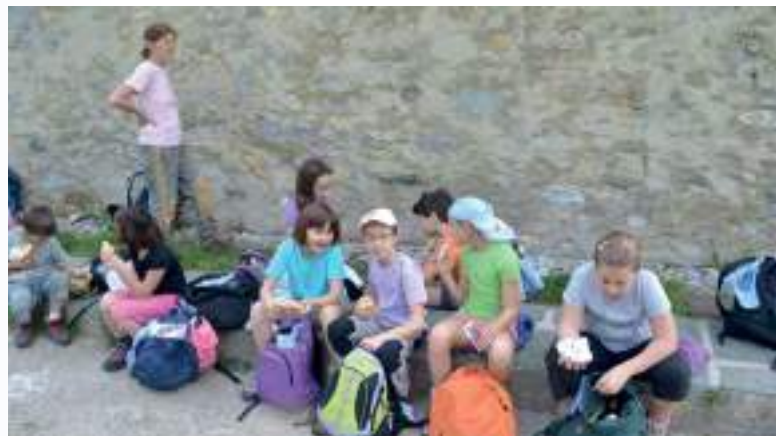
In alto a sinistra: Baita Patrizi (2011)