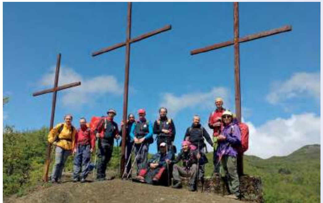
In alto a sinistra: trekking Via degli Abati Bobbio-Bardi... cercando il guado (2016) In alto a destra: trekking Via degli Abati Pontremoli-Bardi, arrivo in vista (2017) In basso a sinistra: trekking Via degli Abati Bobbio-Bardi, incontri ravvicinati (2016) In basso a destra: trekking Via degli Abati Pontremoli-Bardi, alle Tre Croci (2017)