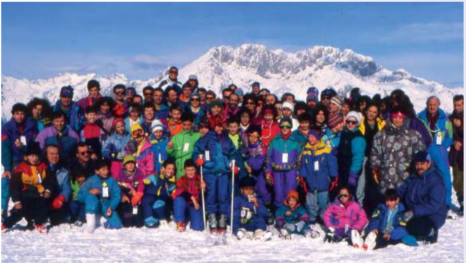
In alto a sinistra: Monte Pora, fondisti della... domenica (anni '90)