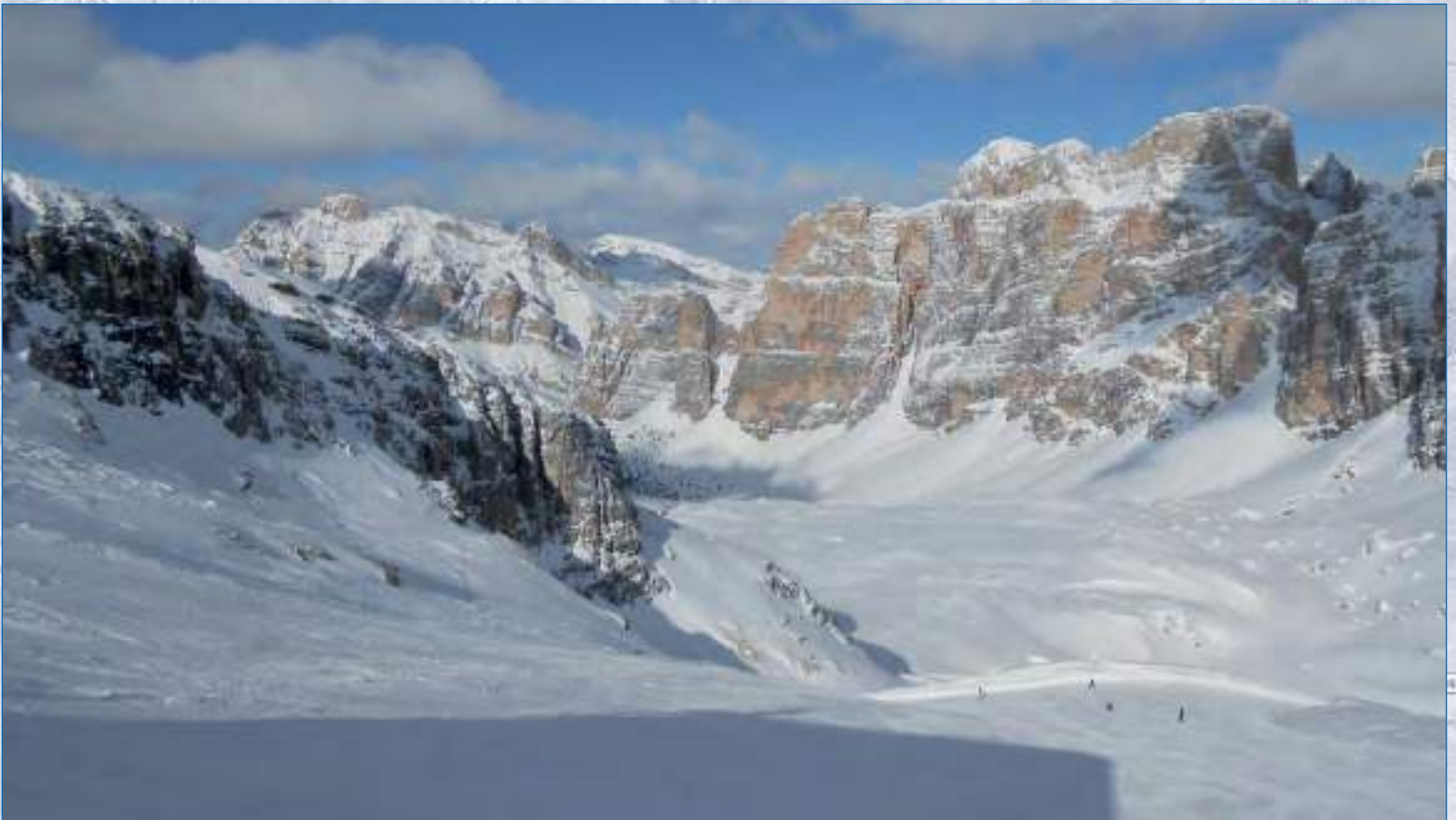
Dal Lagazuoi verso l'Alta Badia