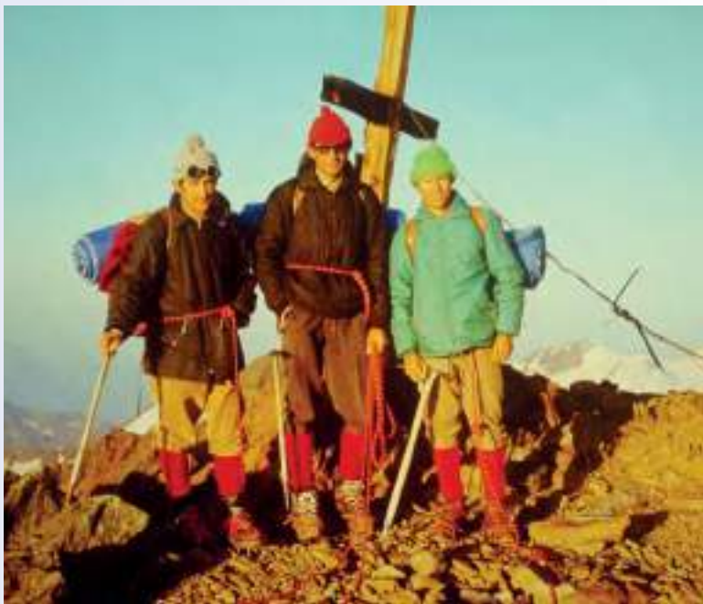
In alto a sinistra: Punta d'Arbola, Val Formazza, 3235 mt (1996) A destra: Pizzo Tamborello, 2858 mt (1969) In basso a sinistra: Monte Vioz, 3645 mt (1970)