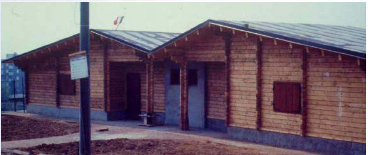
Dalle fondazioni al tetto (1987-1988)