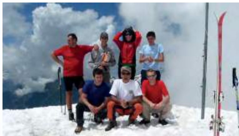
In alto: Rifugio Vajolet, Val di Fassa, 2263 mt (2007) In basso a sinistra: sulla neve a La Thuille (anni '90) In basso a destra: Monte Canino (2009)