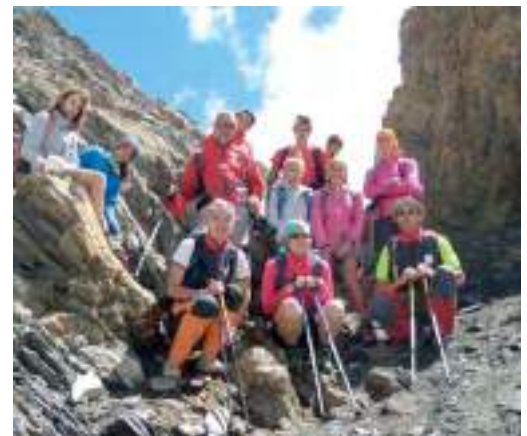
In alto a sinistra: Rifugio Monzino, Val Veny, 2590 mt (2017) In alto a destra: Pietra Parcellara, Val Trebbia, 836 mt (2017) In basso a sinistra: Lago d'Arpy, 2066 mt (2016) In basso a destra: Col de Malatrà, Val Ferret, 2925 mt (2017)