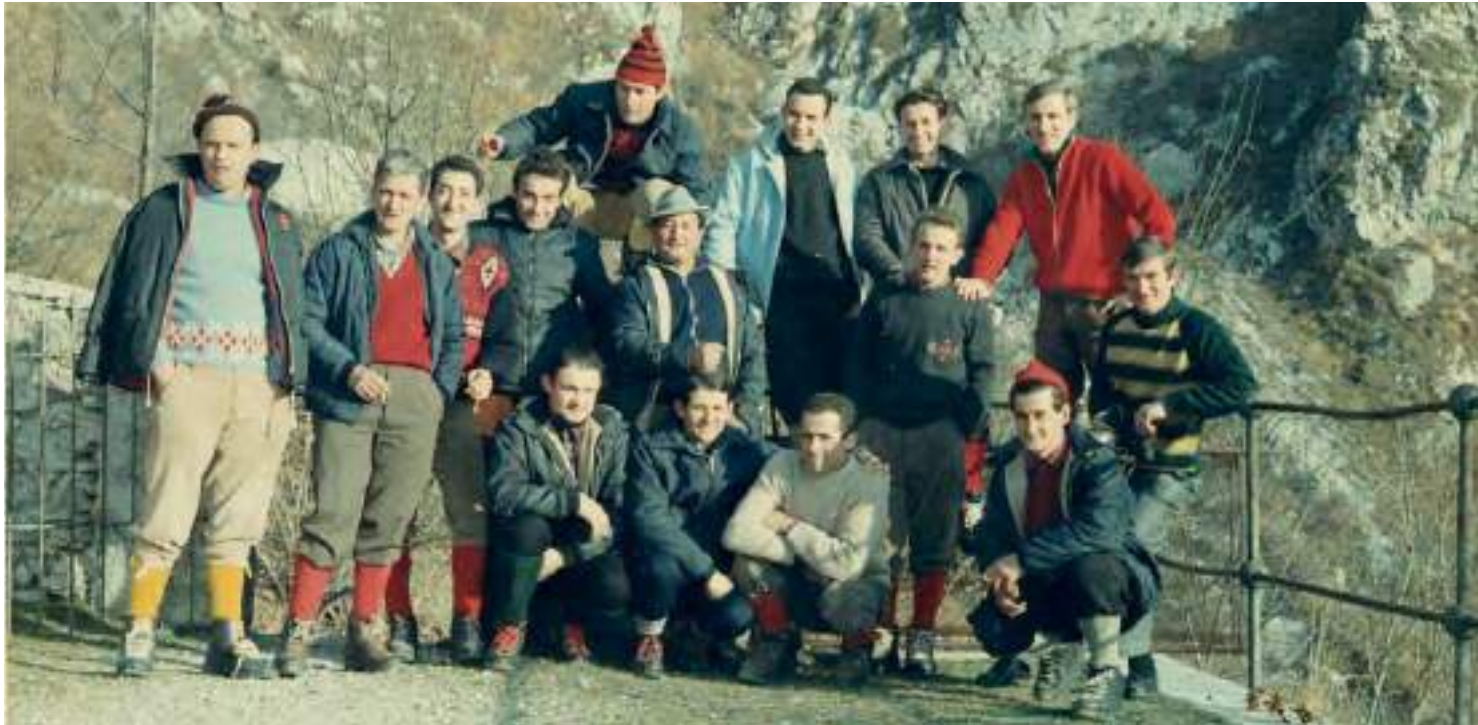
Al Rifugio Alpinisti Monzesi (anni '70)