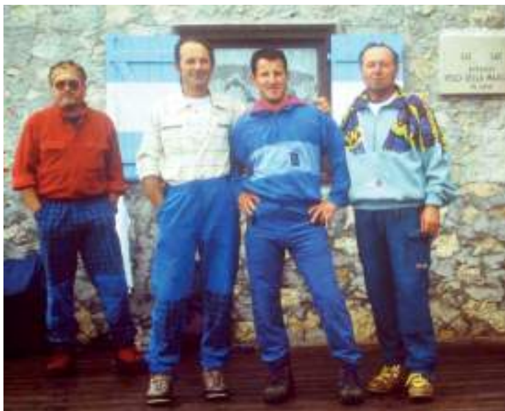
Rifugio Madonna del Velo, Pale di San Martino 2358 mt (2000)

Il cammino continua. Ad ogni passo ne segue un altro, ad ogni sentiero uno nuovo, dopo ogni montagna un'altra ci aspetta. È solo camminando che si apre sempre un nuovo orizzonte; un cammino che assume maggior valore quando siamo capaci di percorrerlo "insieme".