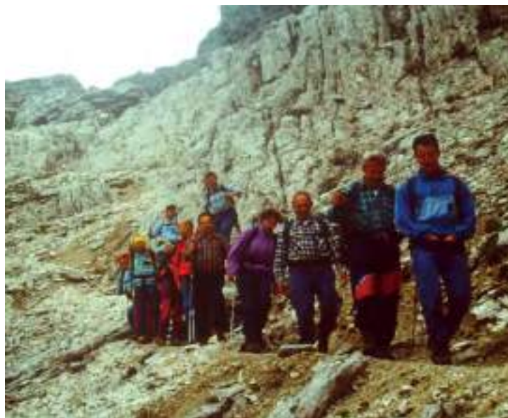
Sentiero delle Pale di San Martino, 2358 mt (2000)