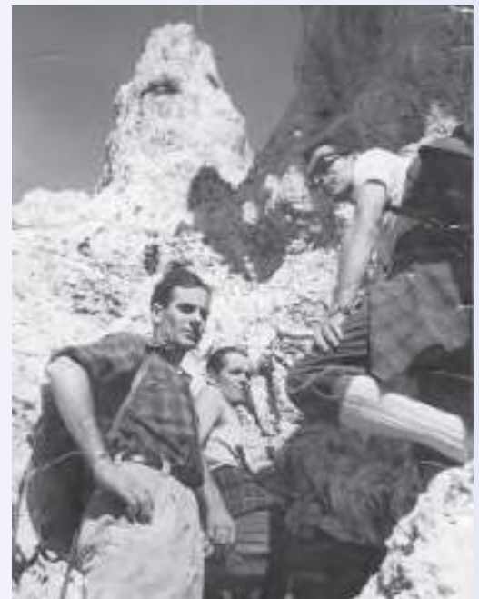
In alto a sinistra: si canta in allegria (anni '60) In alto a destra: sempre in gruppo (anni '60) In basso a sinistra: Presolana, 2521 mt (anni '60) In basso al centro: Dolomiti di Brenta (1969) In basso a destra: Presolana, 2521 mt (anni '60)