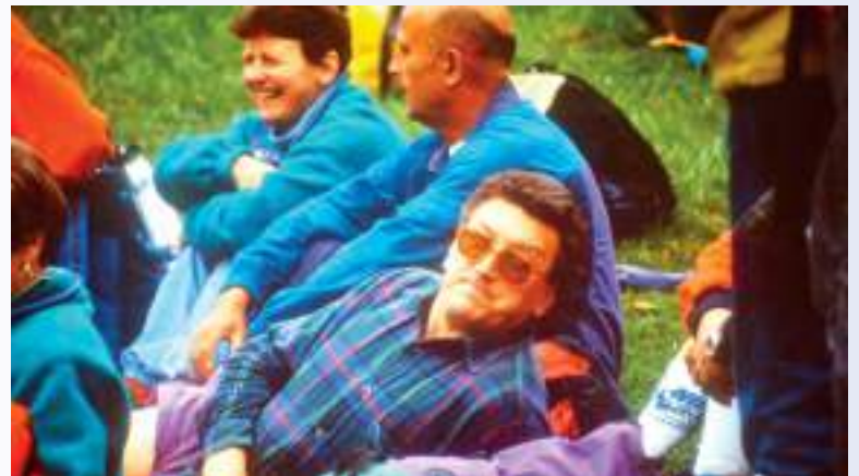
In alto: Passo del Fo, 1284 mt, Gruppo del Resegone (anni '90)