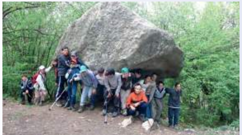
A sinistra: Grignetta, sentiero della Direttissima (2006)