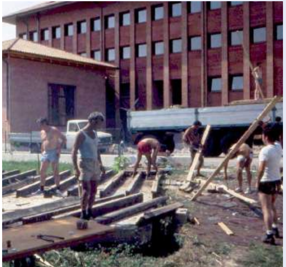
Magnano in Riviera (Friuli), si smontano le baite (agosto 1987)