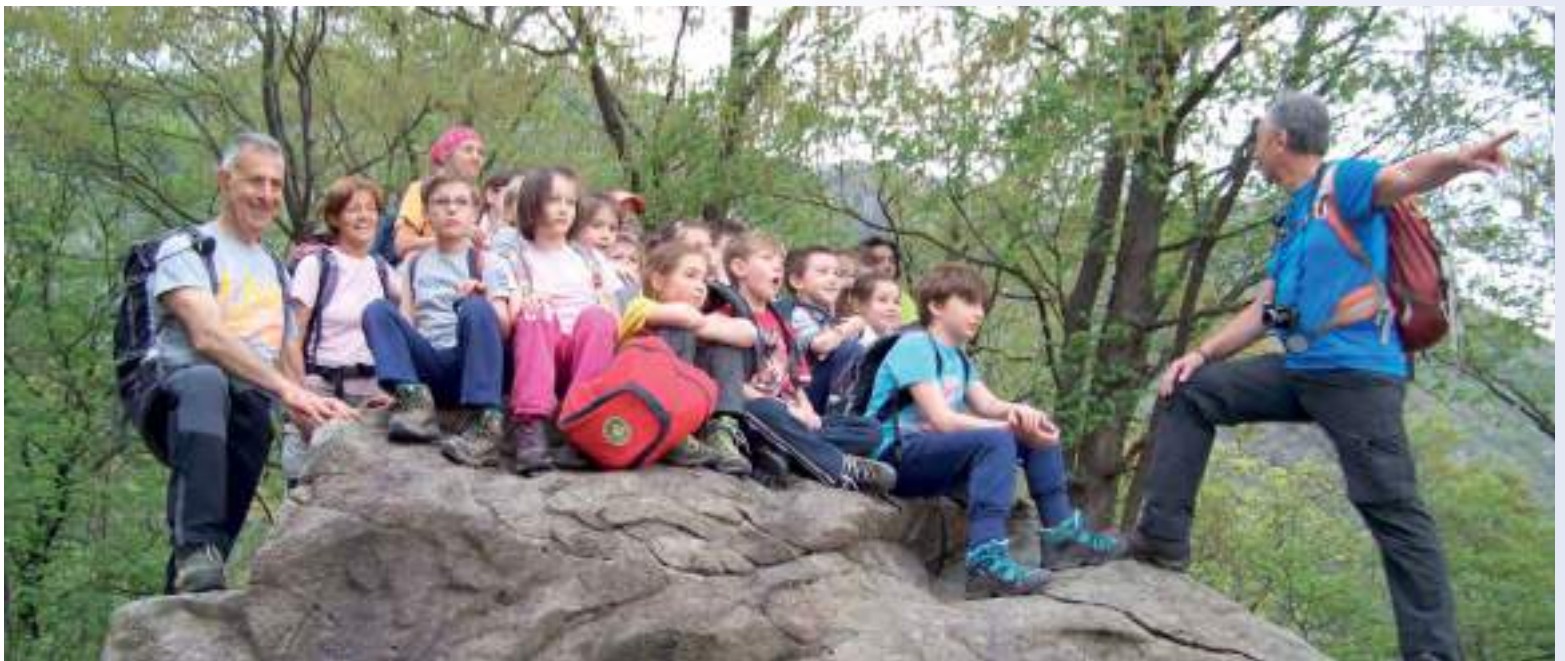
In alto a sinistra: sentiero dei Faggi, dorsale del Bolettone (2016)