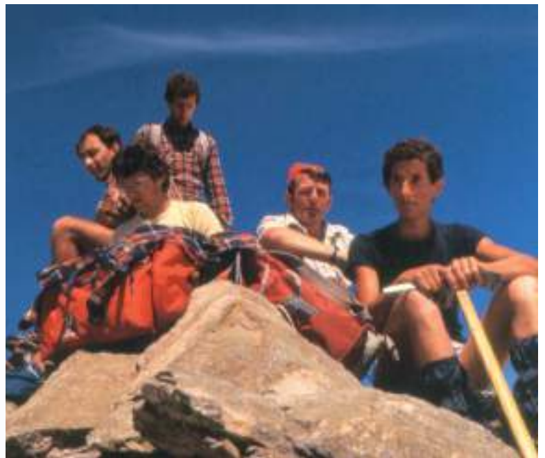
In alto a sinistra: Cima di Lago Scuro, 3166 mt (anni '70)