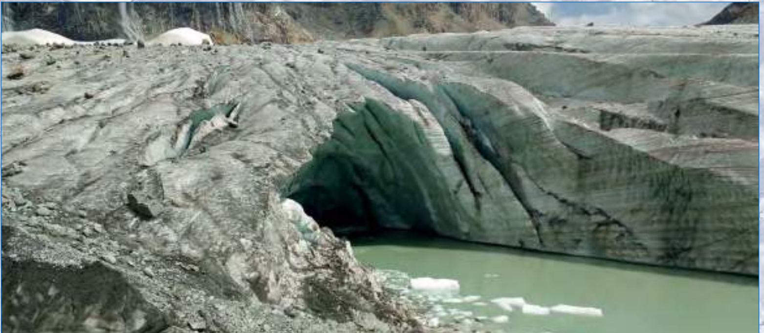
Ghiacciaio di Fellaria, Valmalenco, 2800 mt circa