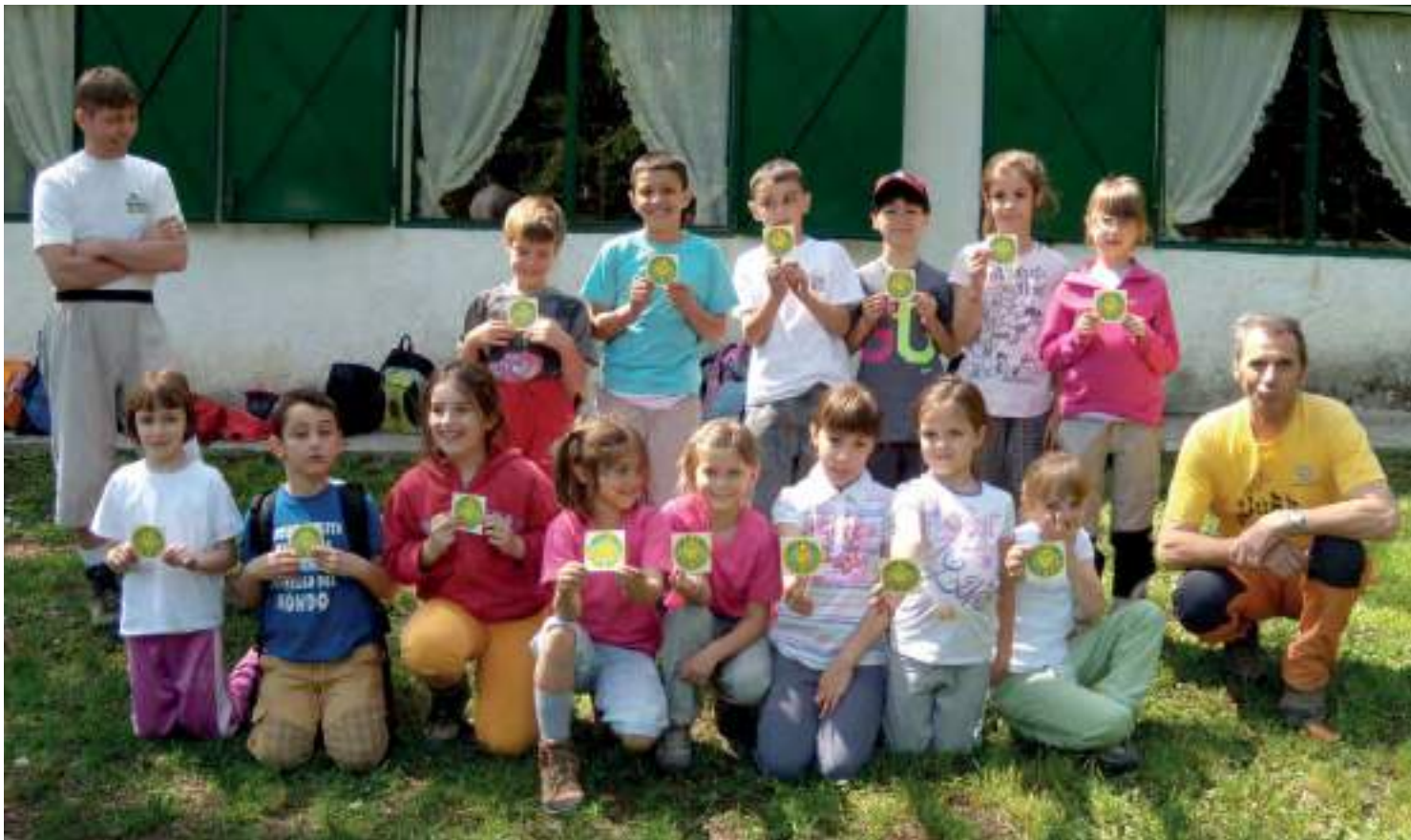
Baita Patrizi (2011)

Che sia un cammino lungo e positivo è la speranza comune.