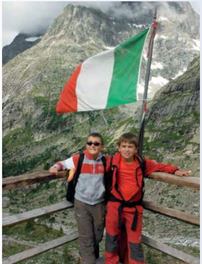
A sinistra: Rifugio Piazza, 767 mt, prove d'arrampicata (2015) A destra: rifugio Elena, Val Ferret, 2062 mt (2015)