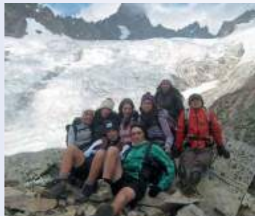
In alto a sinistra: camminando in Val Ferret (2011) In alto a destra: Rifugio Bertacchi, Vallespluga, 2175 mt (2011) In basso a sinistra: Bivacco Fiorio, Val Ferret, 2810 mt (2011) In basso a destra: Mont Chétif, Courmayeur, 2343 mt (2011)