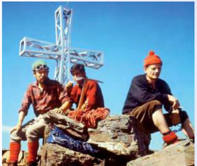
Nella pagina a fianco: Grignetta, Cresta Segantini (1970) A sinistra: Grignetta, Cresta Segantini, preparativi d'arrampicata (1970) In alto a destra: Pizzo del Diavolo, Alpi Orobie, 2914 mt (anni '90) In basso a destra: Pizzo Recastello, Alta Val Seriana, 2886 mt (1970)