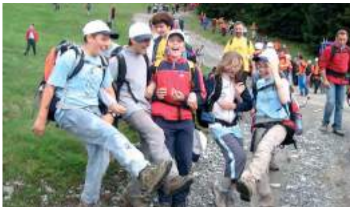
Raduno regionale Alpinismo Giovanile ai Piani d'Erna

Il programma annuale si dilata: l'Alpe del Vicerè, Sostila in Val Fabiollo, la Valsolda, il sentiero del Tracciolino, il sentiero della Direttissima in Grignetta, il sentiero del Cardinello, il Sentiero del Fiume, i Piani d'Artavaggio, il sentiero dei Pizzetti, il santuario della Madonna della Corona, la Pietra Parcellara, la Val Gargassa, i Forti di Genova, tanto per citarne alcune tra le tante mete, vedono i nostri ragazzi impegnati in attività escursionistiche di buon livello e, dove i sentieri si fanno impegnativi trasformandosi in vie attrezzate, attenti nell'approfondire le prime nozioni di arrampicata.