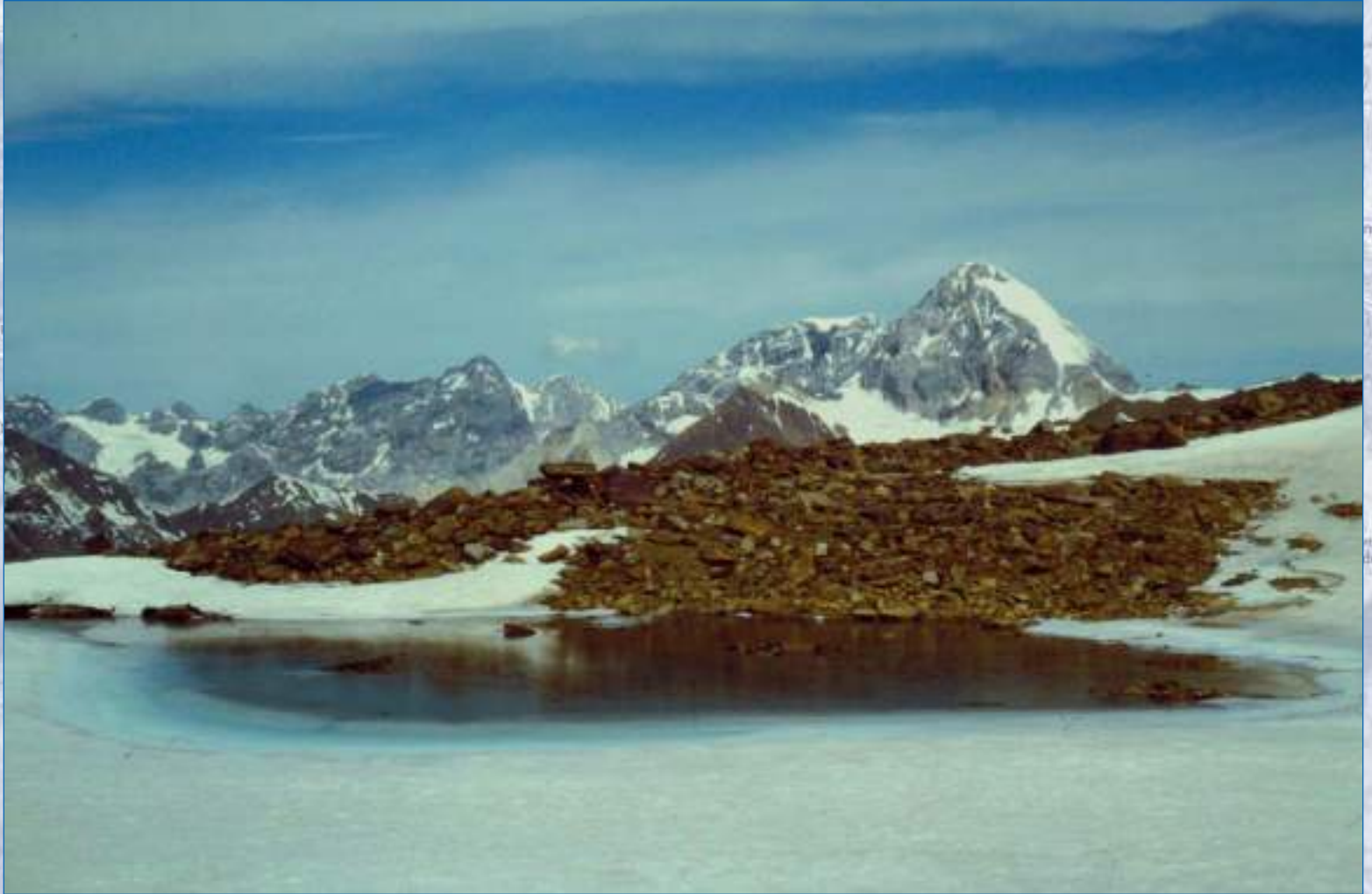
Gran Zebrù, 3850 mt, sullo sfondo l'Ortles, 3905 mt