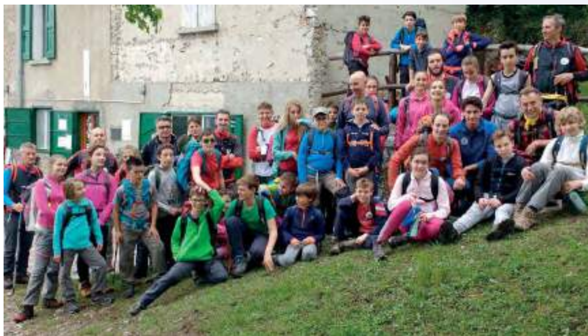
In alto: sentiero del Tracciolino, (2016) In basso: Rifugio Piazza, 776 mt (2017)

Giovane e forte Spirito della Montagna che siedi sulla cima, ascolta la mia preghiera! D'essere puro chiedo più del temporale che forte tambureggia sui tuoi fianchi, o della pioggia rada che ristora a primavera. Signore della pioggia, un'altra cosa chiedo: d'essere forte e agile. Tu che tracci il sentiero del cervo, che tra le aquile hai casa, un'altra cosa chiedo: libera i miei piedi da ogni pigrizia. Tu che tracci i sentieri degli uomini, un'altra cosa chiedo: d'essere retto. Signore delle cime trasparenti che vivi in mezzo ai Tuoni un'altra cosa chiedo, ed è il coraggio. Signore delle praterie, tu che preservi le messi e conservi la forza alle rocce, un'altra cosa chiedo: la costanza.