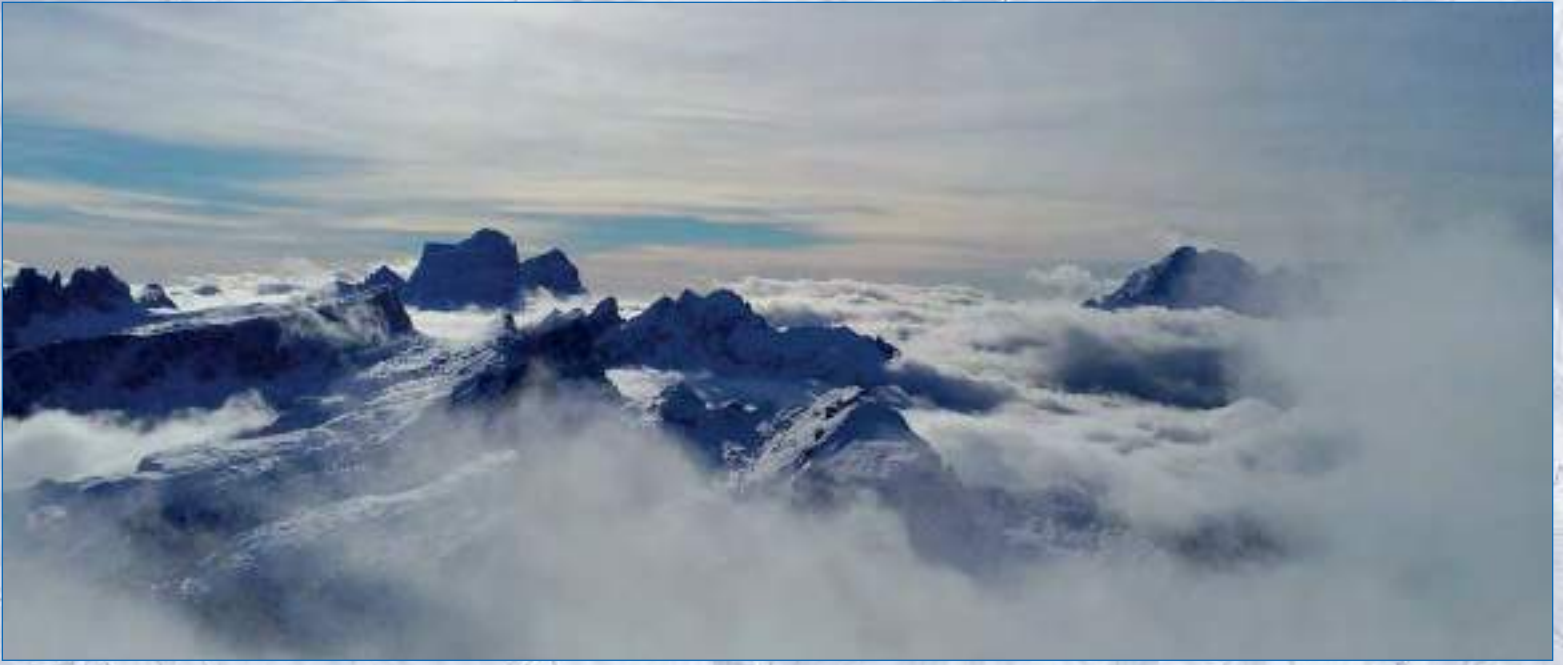
Panorama dal Lagazuoi