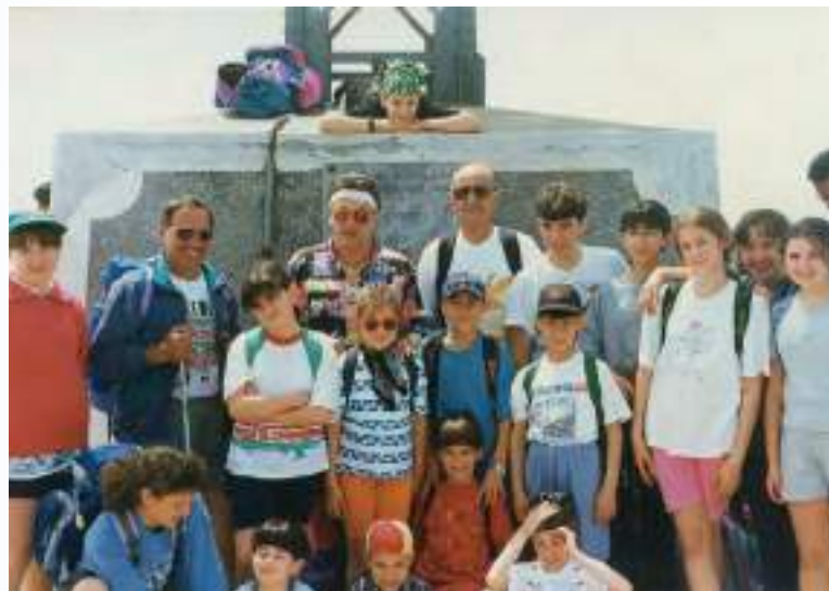
In alto a sinistra: relax durante la salita al Resegone, 1875 mt (anni '90)