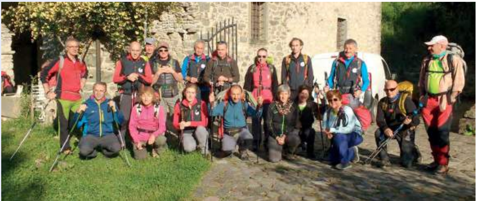
In alto: trekking Via degli Abati Pontremoli-Bardi, Passo del Borgallo, 953 mt (2017) In basso: trekking Via degli Abati Pontremoli-Bardi, partenza da Pontremoli (2017)