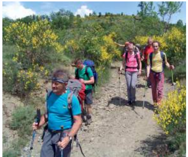
In alto: trekking Via degli Abati Bobbio-Bardi, partenza da Bobbio (2016) In basso a sinistra: trekking Via degli Abati Bobbio-Bardi, arrivo a Bardi (2016) In basso a destra: trekking Via degli Abati Bobbio-Bardi (2016)