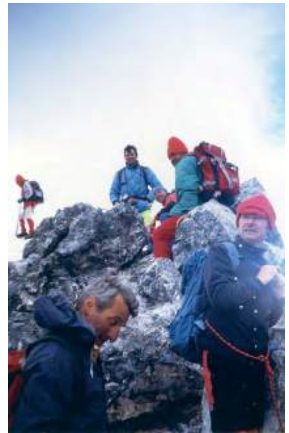
In alto a sinistra: Punta d'Arbola, Val Formazza, 3235 mt (1996)