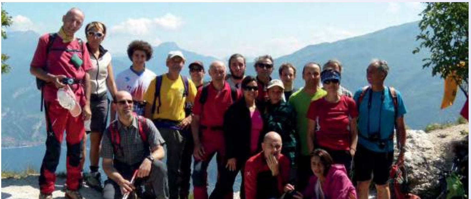
In alto: trekking Acqui Terme-Arenzano, Passo della Gava, 752 mt (2014) In basso: Limone sul Garda (2014)