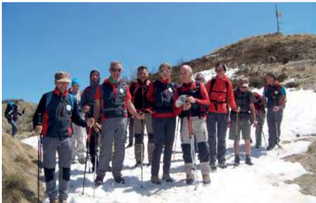
In alto: Pizzo Arera, Val Seriana, 2512 mt (2016)