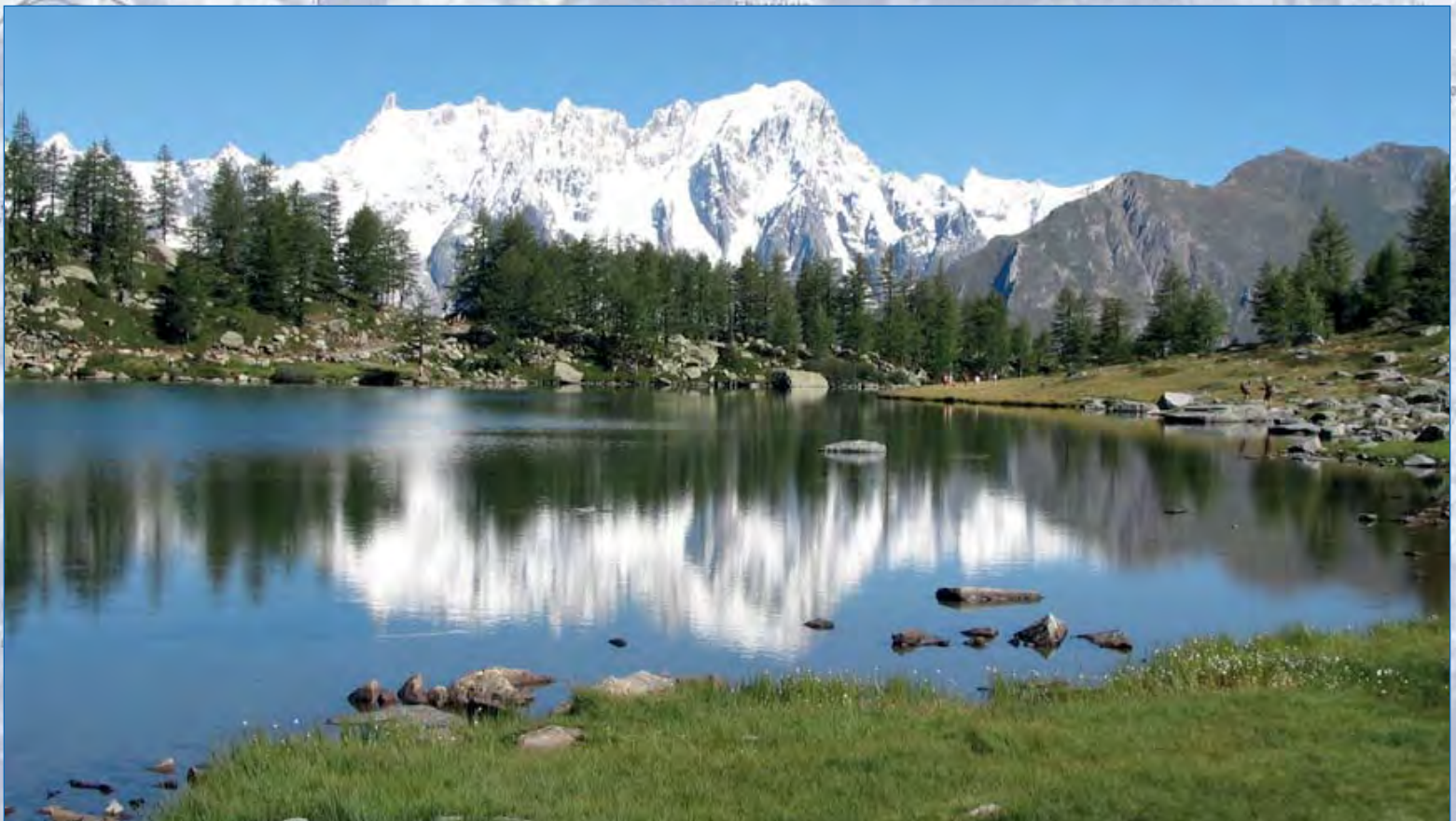
Le Grandes Jorasses, 4208 mt, dal Lago d'Arpy