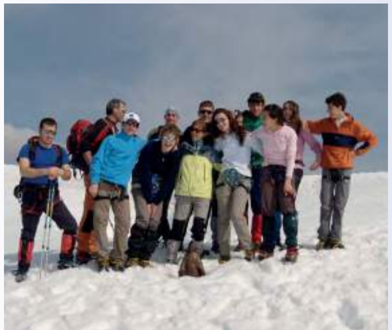
In alto a sinistra: prove d'arrampicata al rifugio Bertacchi, Vallespluga, 2175 mt (2011)