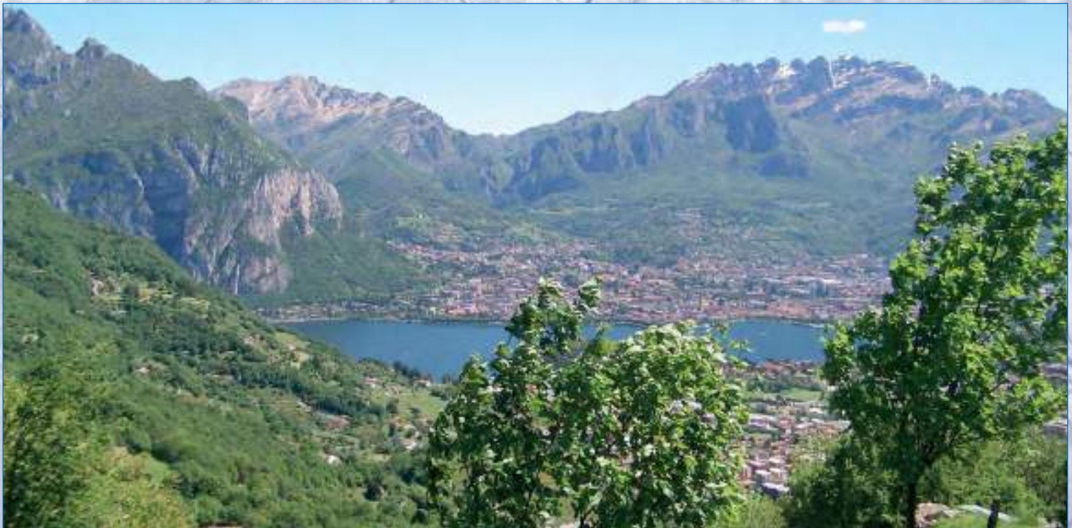
Lecco e il Resegone, 1875 mt