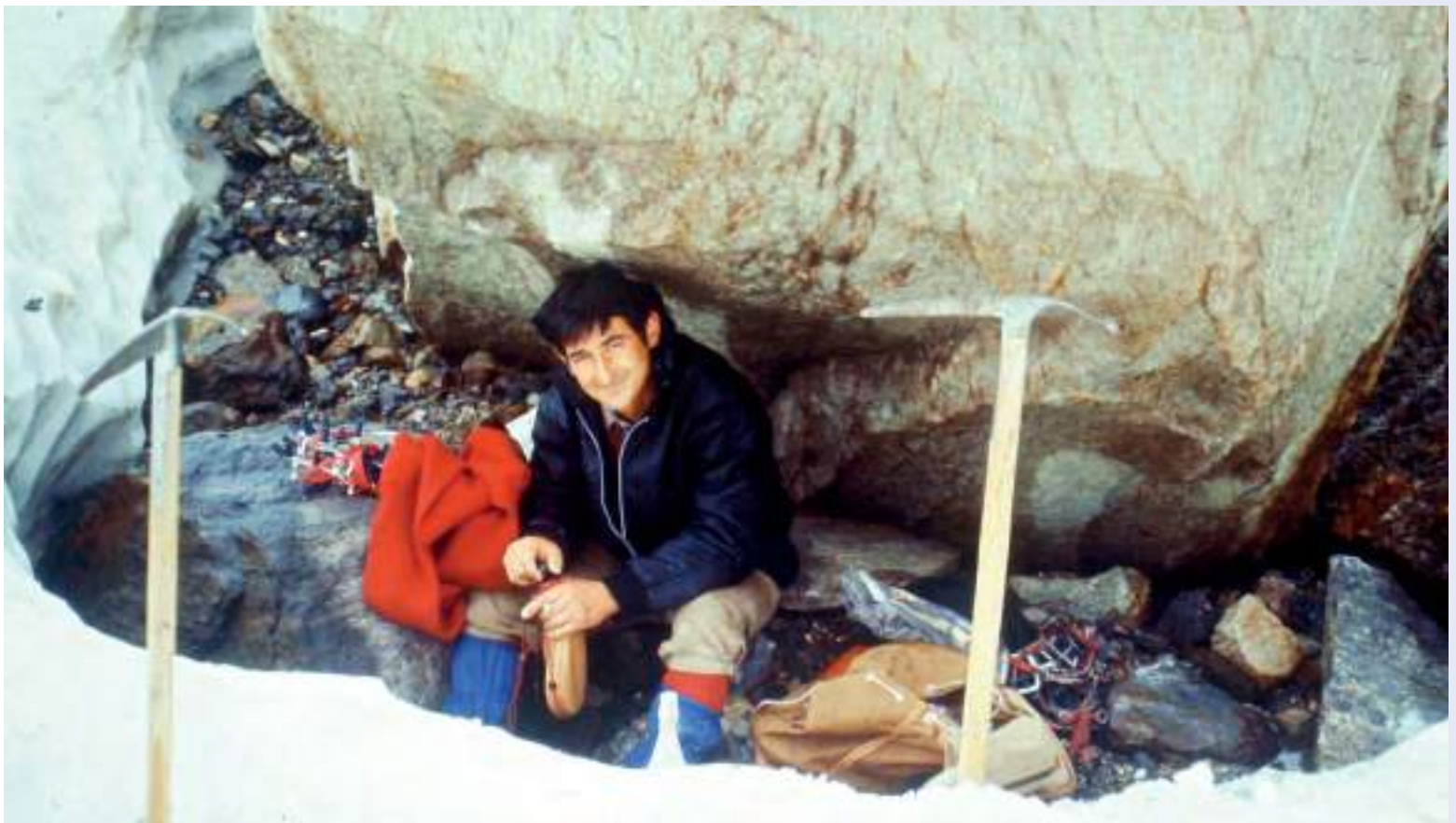
Sosta rigenerante (anni '80)