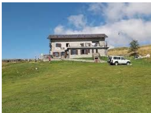
Rifugio Gherardi (Val Taleggio)