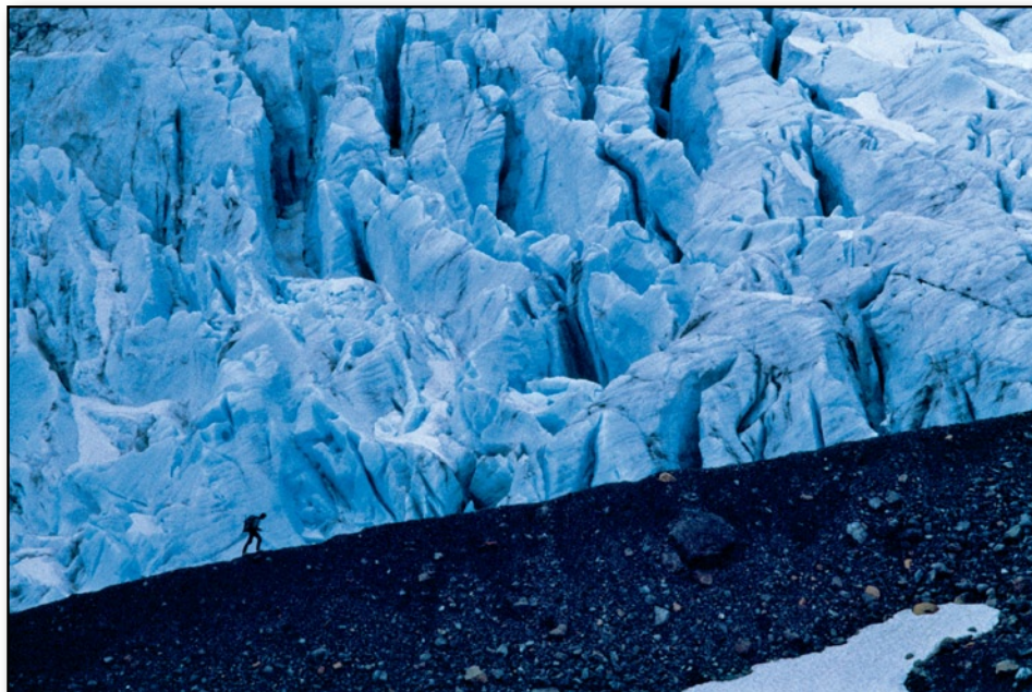
Lyngen ghiacciaio