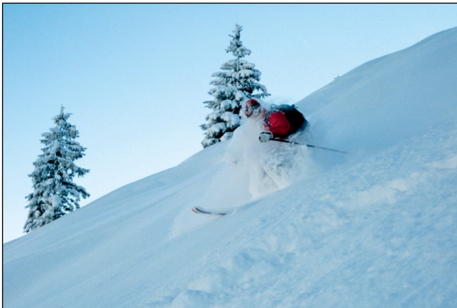
Juifen - Karwendelgebirge