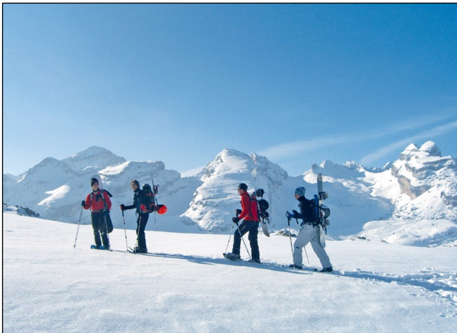
Col Becchi