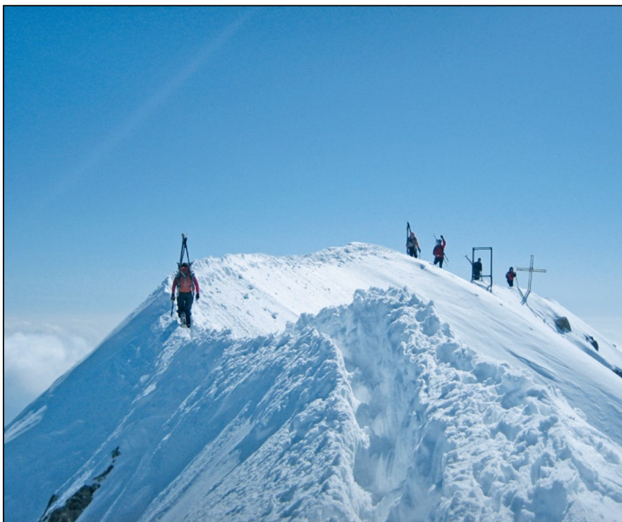
Cima d'Asta