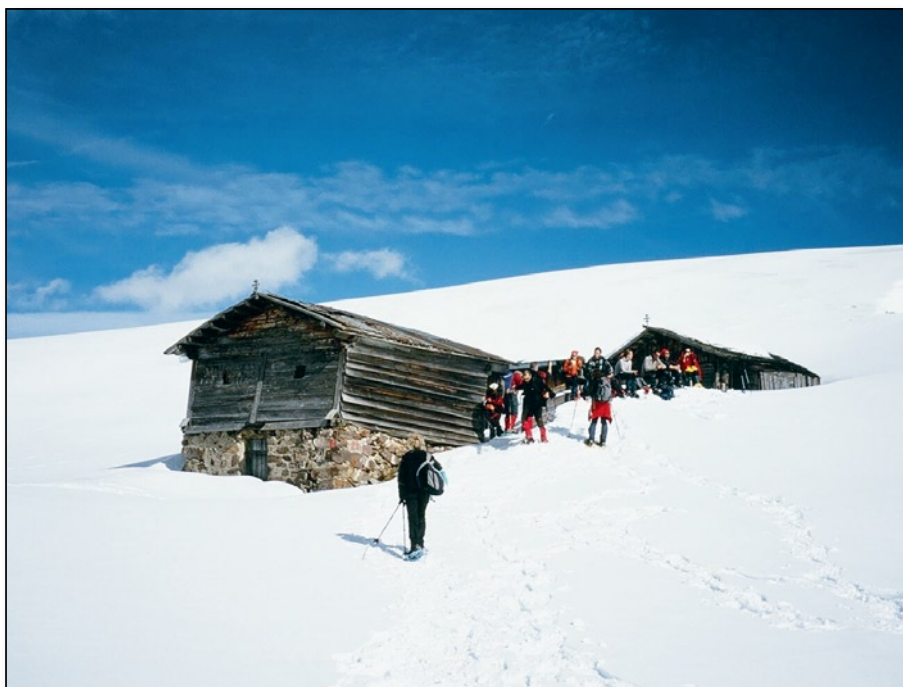
Monti Sarentini