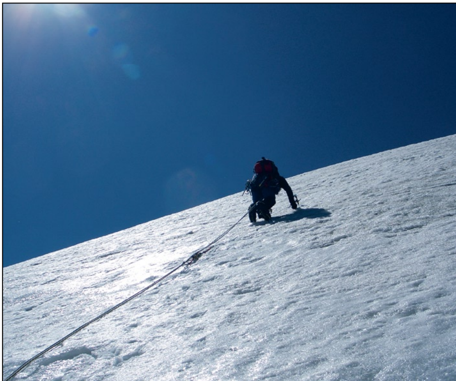
Nord Marmolada