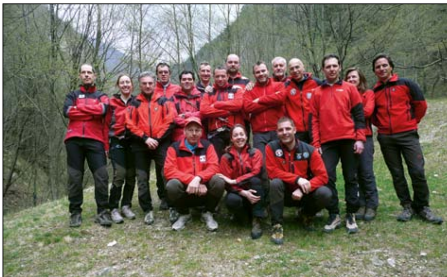
S. Felicita