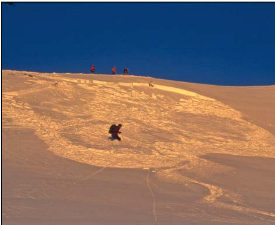
Engadina - foto L. Dalla Vecchia