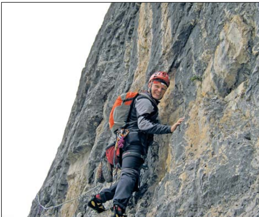
Cima D'Ambiez