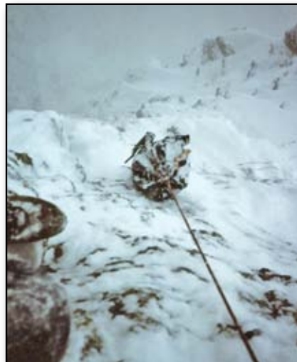
Recupero dello zaino durante la solitaria del Trittico del Freney