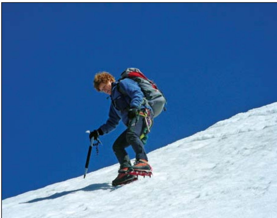
Gran Mesule