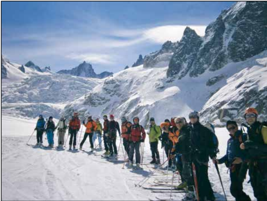
Marzo 2013 - gita sociale sul gruppo del Monte Bianco - discesa della Vallée Blanche

Direttori di gita: R. Saugo, M. Chendi, F. Pavan.